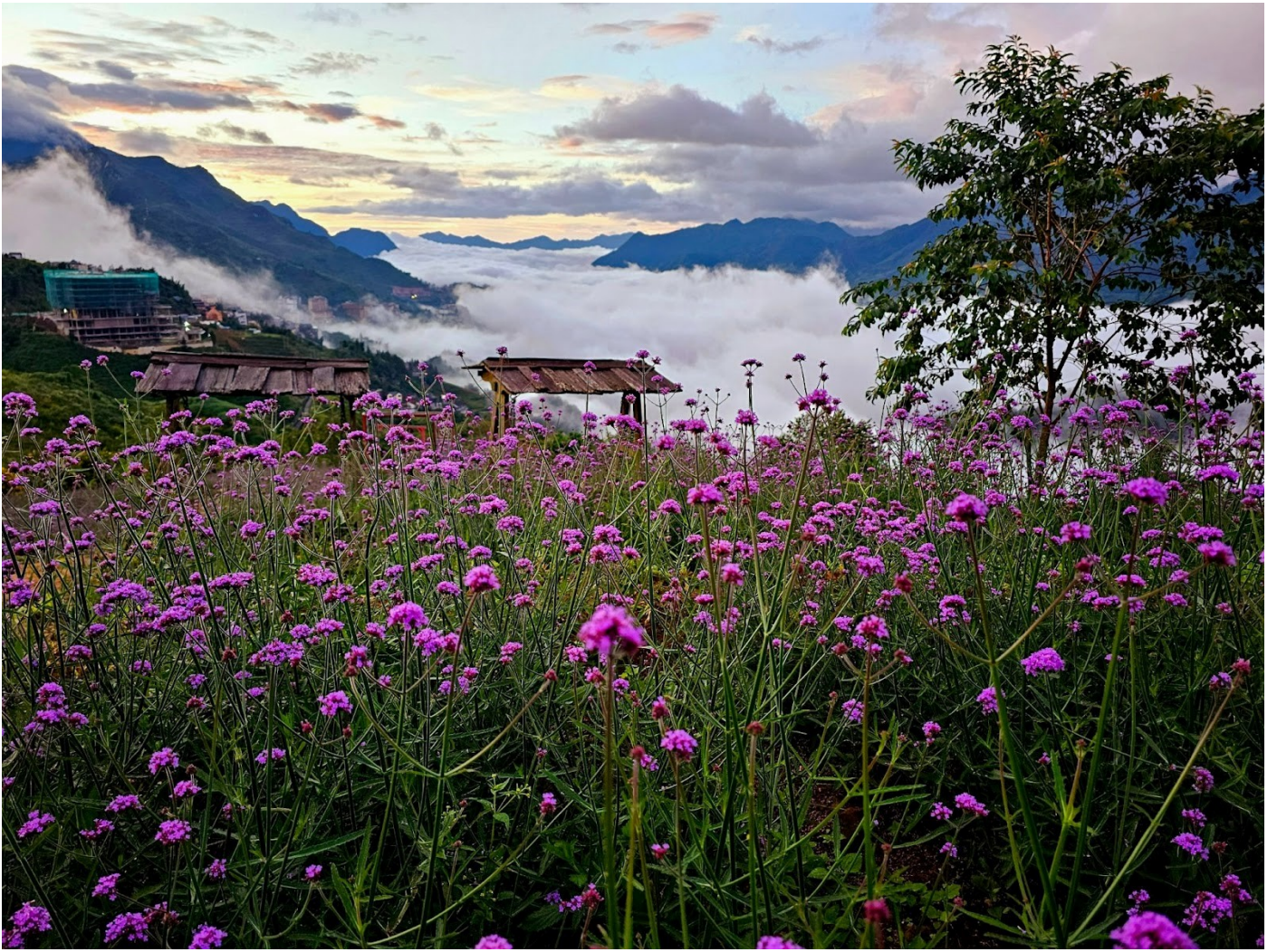
Đồi hoa tím tại Fansipan