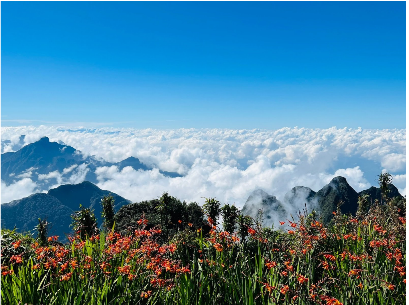
Hoa đơn thóc bung nở trên nóc nhà Đông Dương

Ngoài các mùa hoa nổi bật, Fansipan còn là nơi sở hữu những thảm hoa sao, hoa hướng dương, hoa rum, lan trần mộng, thu thủy hải đường, cẩm tú cầu... đan xen nở rộ khắp các ngày trong năm, khiến cho hành trình khám phá Fansipan của du khách luôn được dẫn lối bằng muôn hoa.