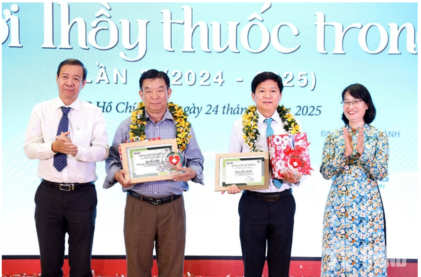
Vinh danh các "Bác sĩ tiêu biểu".

"Chúng tôi mong tiếp tục nhận được sự đồng hành của ngành y tế trong công tác tuyên truyền vì sức khỏe nhân dân, mong tiếp tục nhận được sự ủng hộ của các tác giả chuyên và không chuyên viết về lĩnh vực y tế nói riêng và các lĩnh vực khác để những trang viết của Báo Người Lao Động đến gần hơn với độc giả" ông Tô Đình Tuấn chia sẻ