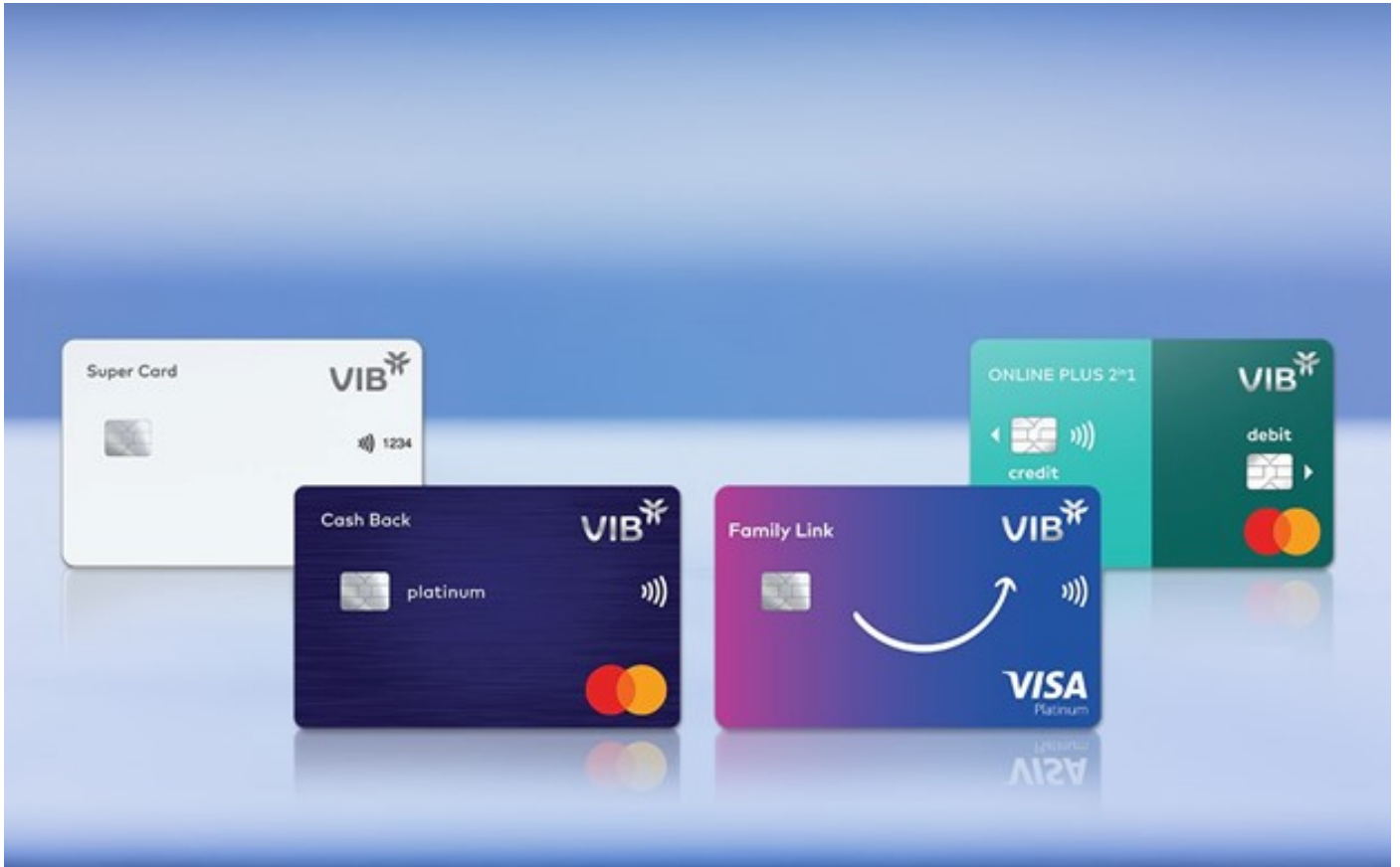
Một số dòng thẻ tín dụng tiêu biểu của VIB.

VIB hiện đang sở hữu một hệ sinh thái thẻ tín dụng đa dạng với 10 dòng thẻ chuyên biệt, mỗi dòng thẻ được thiết kế để mang đến những lợi ích nổi bật, phù hợp với từng nhu cầu chi tiêu khác nhau của khách hàng. Từ du lịch, mua sắm, ẩm thực, chi tiêu hàng ngày, thanh toán trực tuyến, chi tiêu liên kết gia đình, rút tiền mặt cho đến nhiều lĩnh vực khác, VIB đều có những giải pháp thanh toán thẻ tín dụng tối ưu.