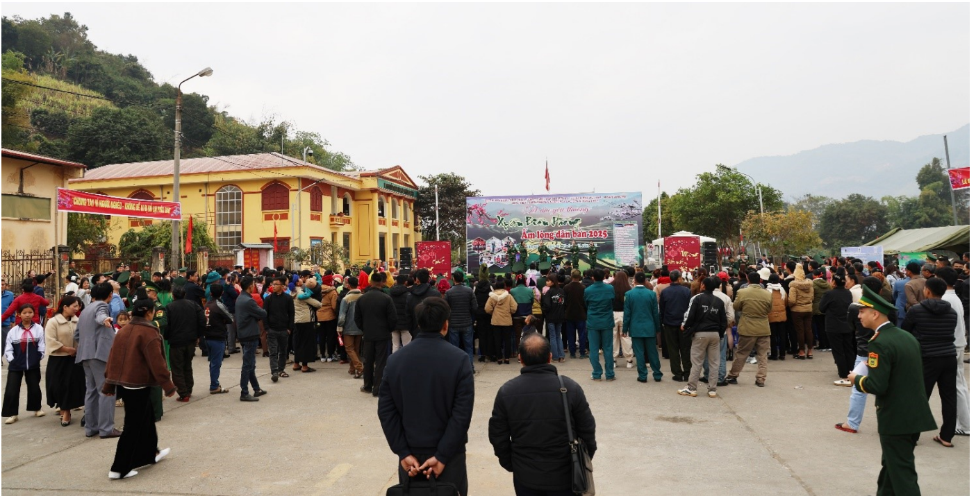
Toàn cảnh chương trình

Trong 2 ngày 18 - 19/1, tại xã Chiềng Khương, huyện biên giới Sông Mã, tỉnh Sơn La, Hội Nhà báo Việt Nam phối hợp với Bộ Chỉ huy Bộ đội Biên phòng tỉnh Sơn La cùng các đơn vị liên quan và nhà tài trợ, nhà hảo tâm đã tổ chức Chương trình "Tết ấm yêu thương - Xuân Biên phòng ấm lòng dân bản năm 2025".