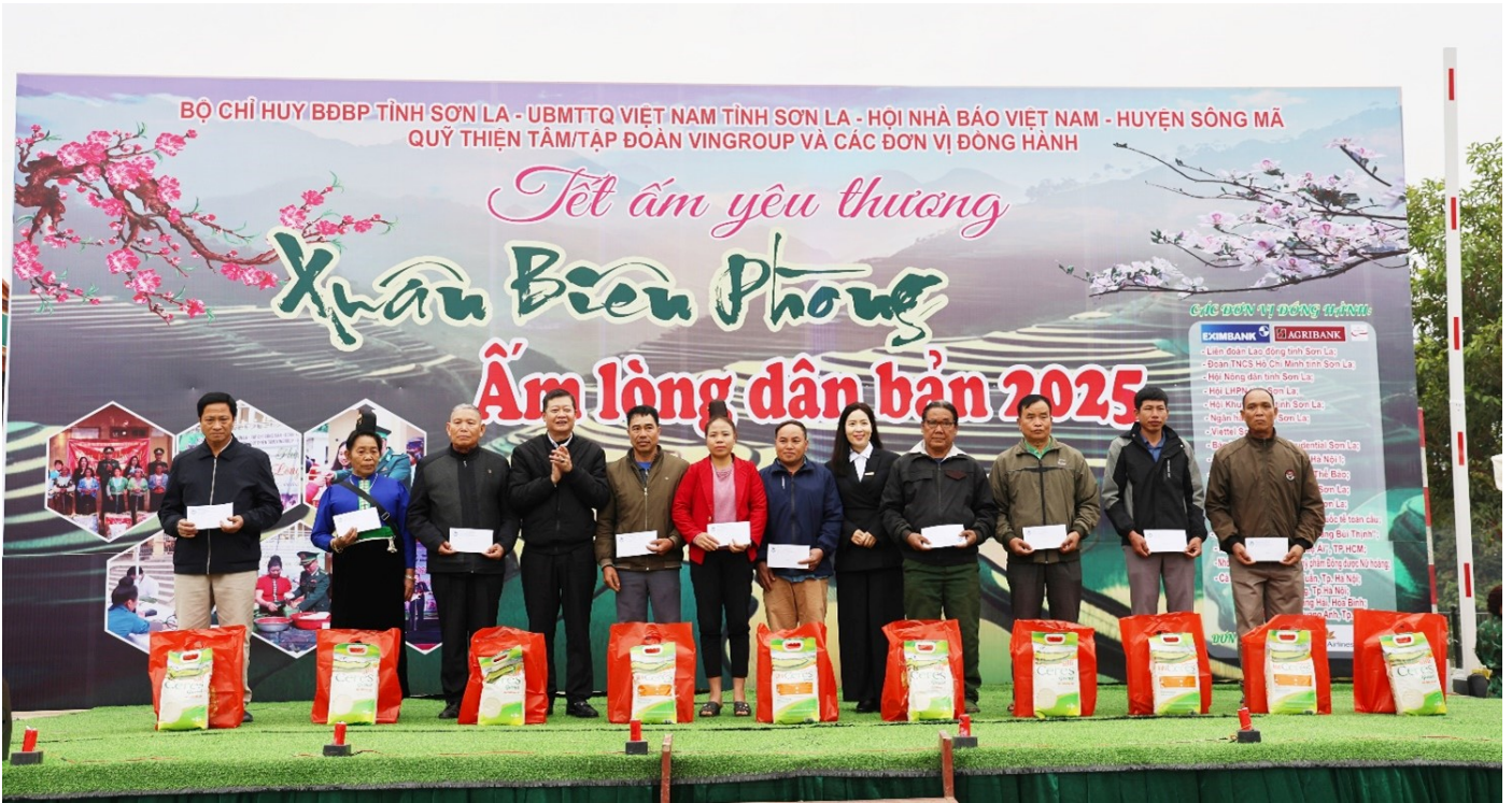
Đại diện Ngân hàng TMCP Xuất Nhập khẩu Việt Nam trao quà cho các hộ gia đình chính sách