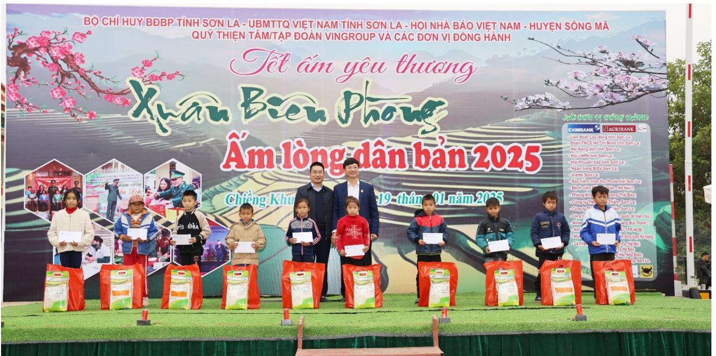
Đại diện Ngân hàng Nông Nghiệp và Phát triển Nông thôn Việt Nam và Đại diện Công ty Cổ phần Phân bón Bình Điền trao quà cho các em học sinh có hoàn cảnh khó khăn