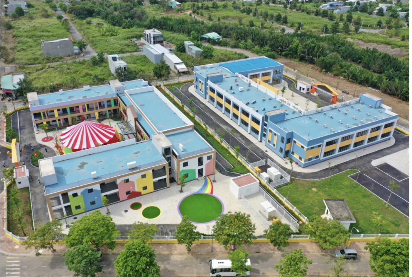
Toàn cảnh trường mầm non và tiểu học Khu tái định cư Thái Sơn.

Ngoài ra, cũng trong ngày 15/1, Công ty cổ phần Thái Sơn - Long An cũng chính thức khánh thành trường mầm non và tiểu học thuộc khu tái định cư Thái Sơn - dự án có quy mô hơn 46 ha, nằm liền kề với dự án T&T City Millennia và được thừa hưởng đầy đủ hạ tầng, tiện ích đồng bộ của đại đô thị. Tổng giá trị xây dựng của 2 ngôi trường là gần 107 tỷ đồng, từ nguồn vốn đầu tư của Công ty cổ phần Thái Sơn - Long An.