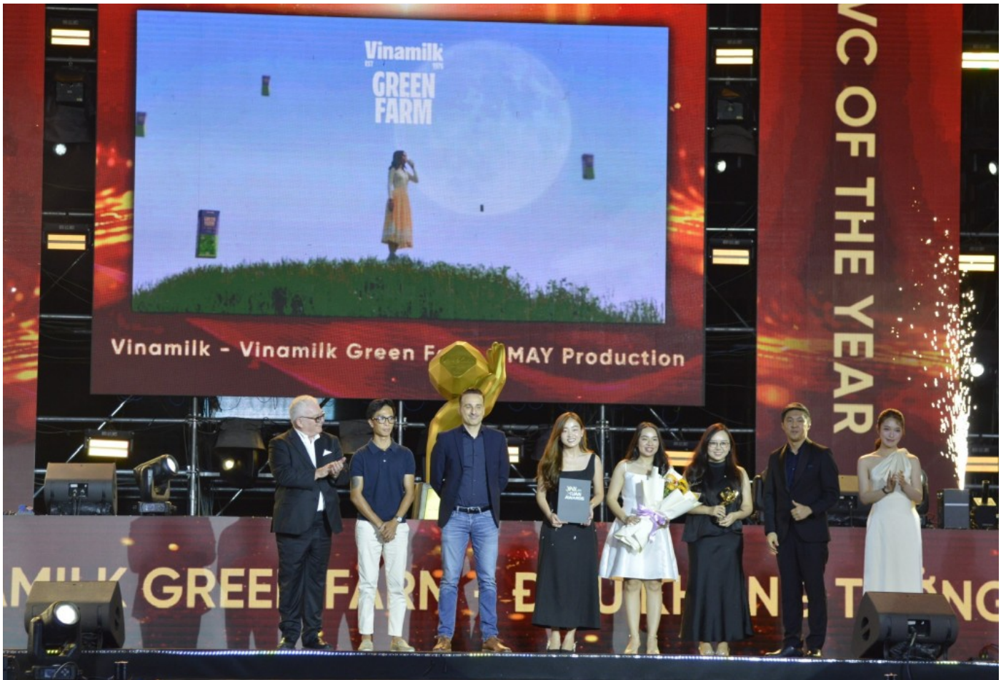
Mẫu quảng cáo (TVC) và chiến dịch ra mắt sản phẩm Vinamilk Green Farm dành giải cao nhất tại Giải thưởng Vạn Xuân 2024

Nhu cầu của người tiêu dùng ngày càng nhiều hơn, cao hơn và đòi hỏi các thương hiệu liên tục đổi mới theo hướng tốt hơn. Với Vinamilk, bên cạnh sự sáng tạo, tinh thần “raise the bar” (luôn cầu tiến) là một yếu tố vô cùng quan trọng trong quá trình đổi mới thương hiệu mà chúng tôi đang thực hiện, để luôn mang đến cho khách hàng những sản phẩm, dịch vụ tốt hơn và tốt hơn nữa.