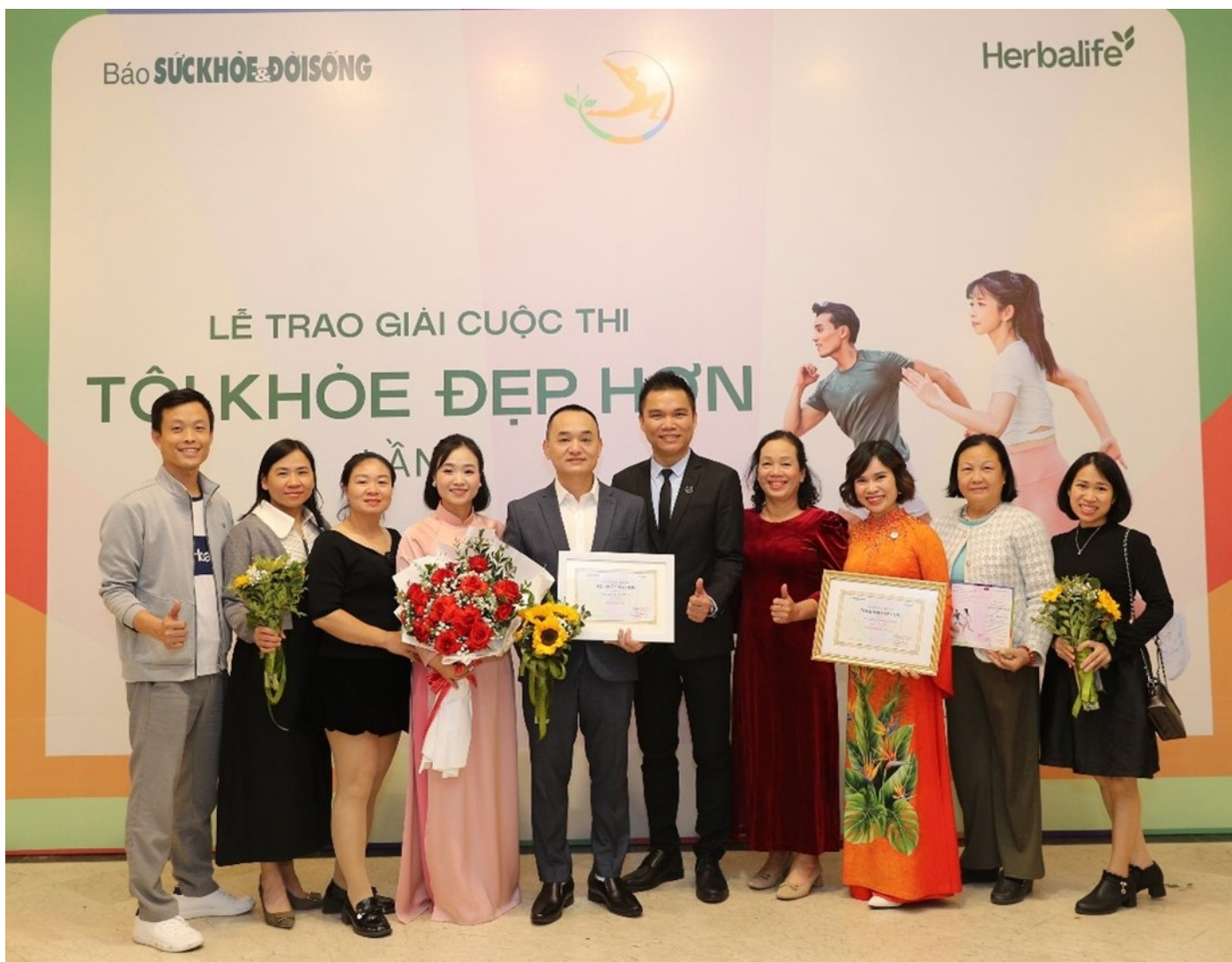
Đại diện đơn vị tài trợ Herbalife Việt Nam chụp ảnh lưu niệm cùng các thí sinh đạt giải