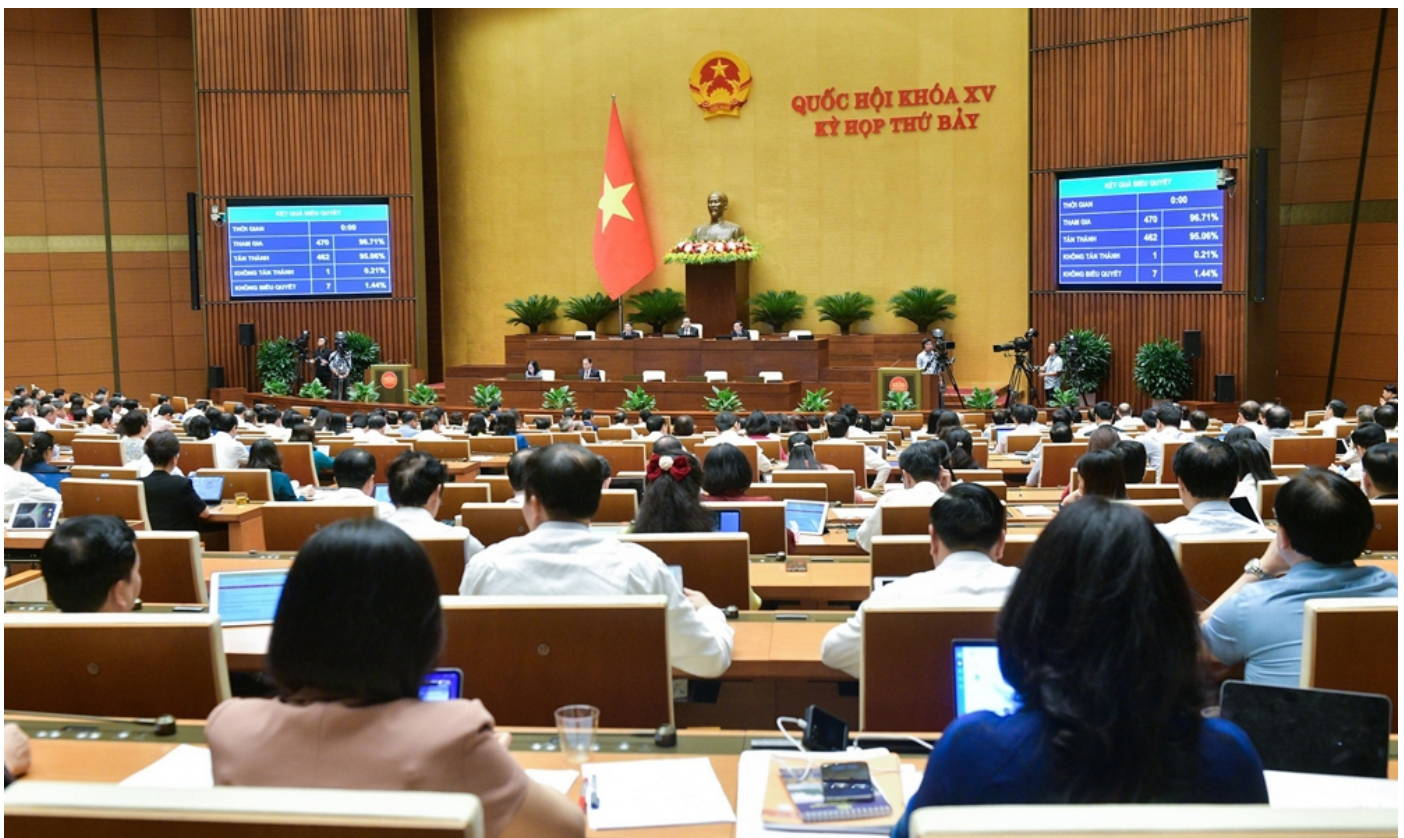
Quốc hội thông qua Luật Thủ đô (sửa đổi).

Ngày 28/6/2024, Quốc hội thông qua Luật Thủ đô (sửa đổi) với cơ chế, chính sách đặc thù vượt trội. Luật tạo cơ sở pháp lý quan trọng để Thủ đô phát huy quyền tự chủ, tháo gỡ các nút thắt trong quản lý, huy động nguồn lực, thu hút nhân tài, thúc đẩy đổi mới sáng tạo, phát triển bền vững... Đây là cơ sở pháp lý để thành phố Hà Nội thực hiện các nhiệm vụ chiến lược đã được xác định tại Nghị quyết 15-NQ/TW của Bộ Chính trị, hướng tới mục tiêu.