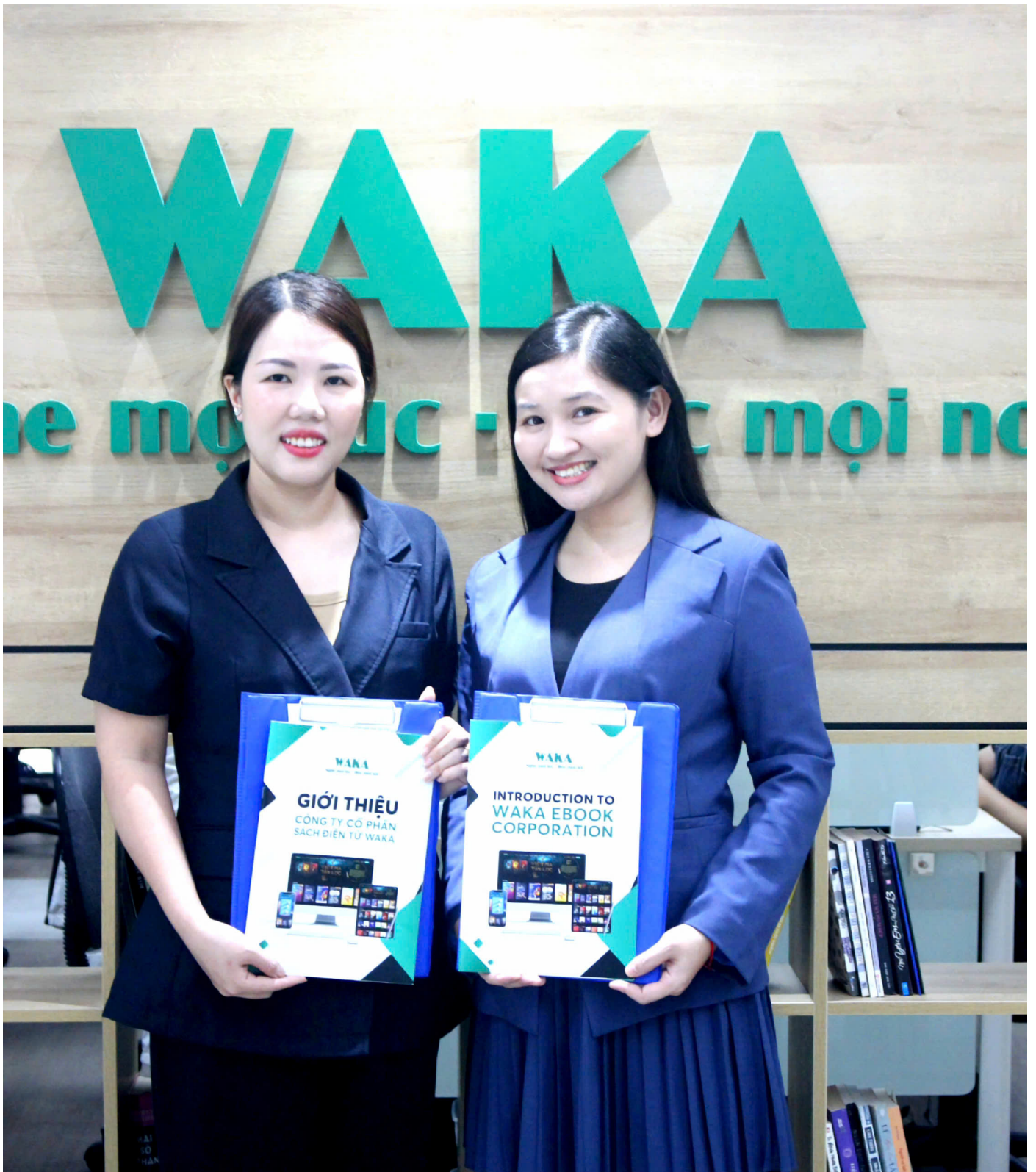
Đại diện WAKA và tác giả của Trường ca “Lũ”.

Với dự án này, WAKA là đối tác xuất bản và bảo trợ truyền thông cho dự án này, đóng vai trò cầu nối giữa tác giả, độc giả và cộng đồng. Qua con đường công nghệ số, đội ngũ thực hiện mong muốn tác phẩm phủ sóng mạnh mẽ trên khắp mọi miền đất nước, phá vỡ mọi rào cản về khoảng cách địa lý, đồng thời lan tỏa tinh thần nhân văn sâu sắc, quy tụ sự đồng hành từ những tấm lòng nhân ái trên mọi miền Tổ quốc. Theo đó, trường ca “Lũ” sẽ là một ấn phẩm đặc biệt, được phát