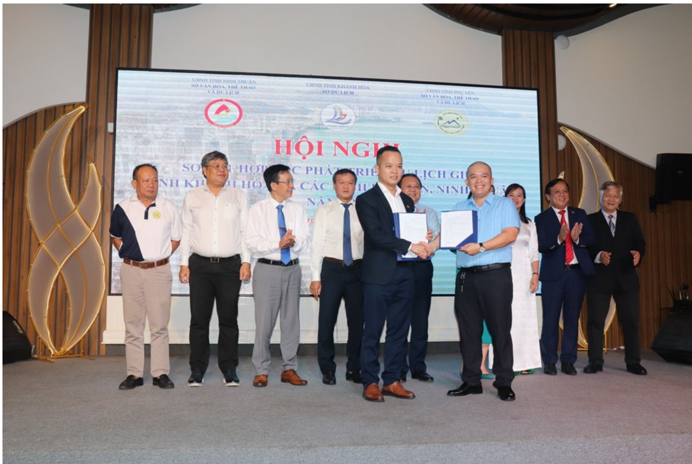
Doanh nghiệp các địa phương ký kết hợp tác phát triển du lịch

Đặc biệt, trong khuôn khổ chương trình, các doanh nghiệp du lịch Khánh Hòa, Phú Yên, Ninh Thuận đã ký kết hợp tác phát triển du lịch.