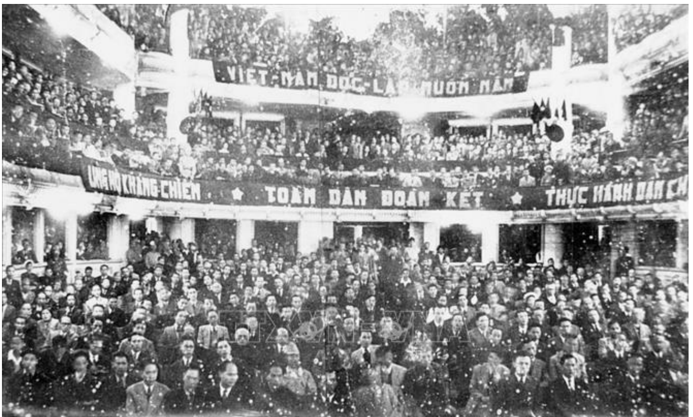
Quang cảnh buổi khai mạc kỳ họp thứ nhất, Quốc hội khoá I, ngày 2/3/1946

Gần 80 năm đồng hành cùng đất nước, Quốc hội - cơ quan đại biểu cao nhất của Nhân dân, cơ quan quyền lực nhà nước cao nhất của nước Cộng hòa xã hội chủ nghĩa Việt Nam đã thể hiện vai trò đặc biệt quan trọng trong cải cách thể chế. Thông qua việc thực hiện các chức năng lập hiến, lập pháp, quyết định các vấn đề quan trọng của đất nước và giám sát tối cao, Quốc hội từng bước tạo lập các cơ sở pháp lý quan trọng, vững chắc cho công cuộc đổi mới toàn diện đất nước mà trọng tâm là xây dựng Nhà nước pháp quyền xã hội chủ nghĩa của Nhân dân, do Nhân dân, vì Nhân dân, xây dựng, phát triển nền kinh tế thị trường định hướng xã hội chủ nghĩa, bảo đảm quốc phòng - an ninh, tôn trọng, bảo đảm, bảo vệ quyền con người, quyền công dân và hội nhập quốc tế.