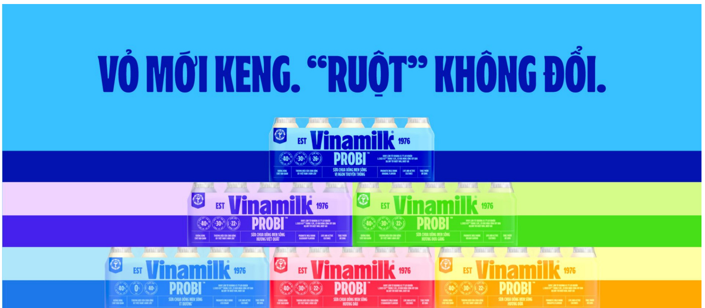
Nhiều sản phẩm Vinamilk đồng loạt đổi “áo” mới trong thời gian qua

Đáng chú ý, các sản phẩm này đều có kết quả kinh doanh khả quan. Điều này cũng cho thấy các thay đổi của Vinamilk đang đi đúng hướng và có tác động tích cực đến thị trường.