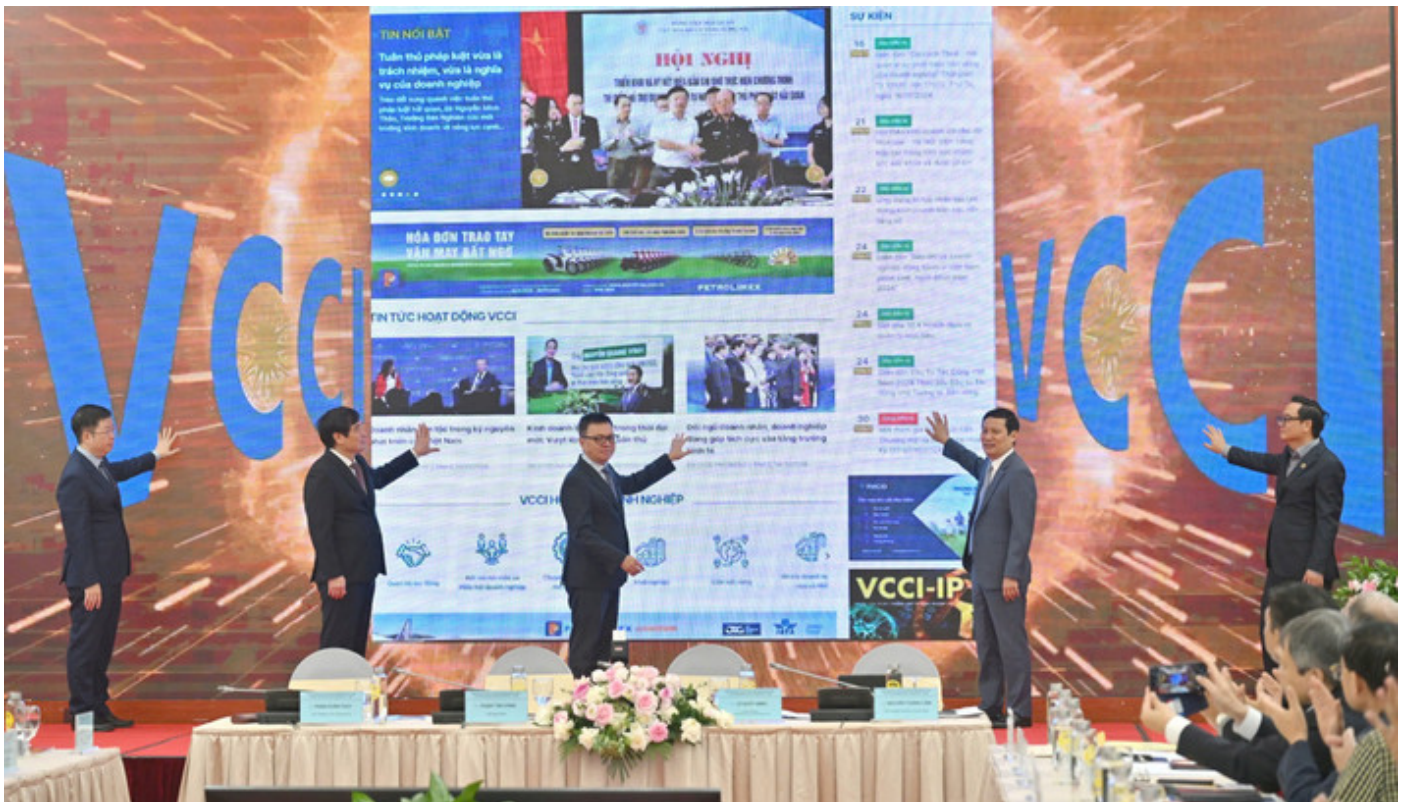
Các đại biểu bấm nút khai trương giao diện mới cho Trang thông tin điện tử của Liên đoàn Thương mại và Công nghiệp Việt Nam.