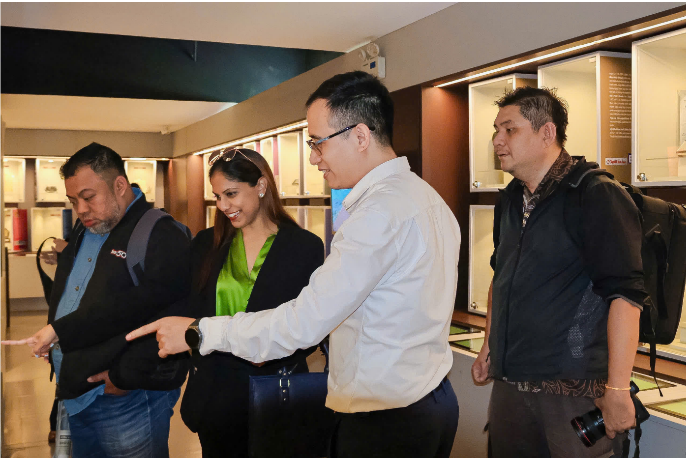
Đoàn đại biểu Liên hiệp nhà báo quốc gia Malaysia (NUJ) tham quan Bảo tàng Báo chí Việt Nam.

Thành viên của liên hiệp trước đây chỉ giới hạn trong các nhà báo làm việc cho báo in, đài phát thanh và truyền hình, nhưng giờ đây đã được mở rộng đến các cổng thông tin trực tuyến. Gần đây, chúng tôi đã chào đón MalaysiaKini trở thành chi nhánh mới nhất của NUJM.