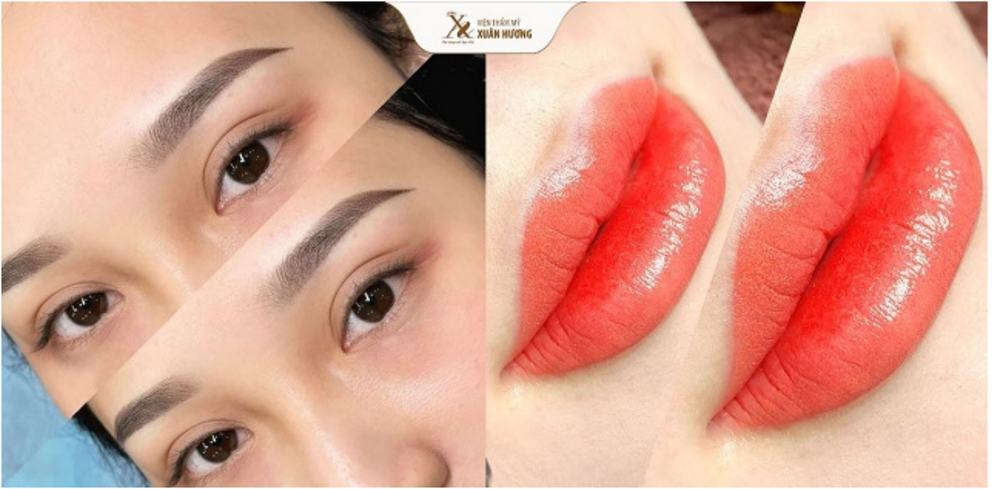
Kết quả phun mày & phun môi tại Viện Thẩm mỹ Xuân Hương

Cắt mí trên Minideep 6D ưu đãi còn 6,9 triệu + tặng thêm chiếu ánh sáng kháng khuẩn giúp hồi phục nhanh. Sau 5 ngày sở hữu nếp mí đẹp tự nhiên, sắc nét, đôi mắt cuốn hút.