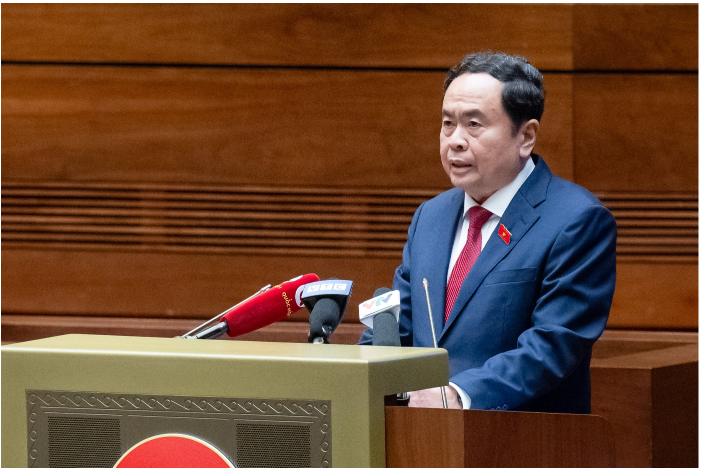
Chủ tịch Quốc hội Trần Thanh Mẫn phát biểu chỉ đạo tại lễ ra mắt cuốn sách.

Quốc hội tổ chức quán triệt, nghiên cứu sâu sắc các quan điểm chỉ đạo của Đảng và đồng chí Tổng Bí thư Nguyễn Phú Trọng để quán triệt, triển khai trong lãnh đạo, chỉ đạo, điều hành và tổ chức thực hiện có hiệu quả các nhiệm vụ, quyền hạn của Quốc hội, các cơ quan của Quốc hội cũng như trong hoạt động tham mưu phục vụ Quốc hội nói chung, nhằm góp phần nâng cao hơn nữa chất lượng, hiệu lực, hiệu quả hoạt động của Quốc hội.