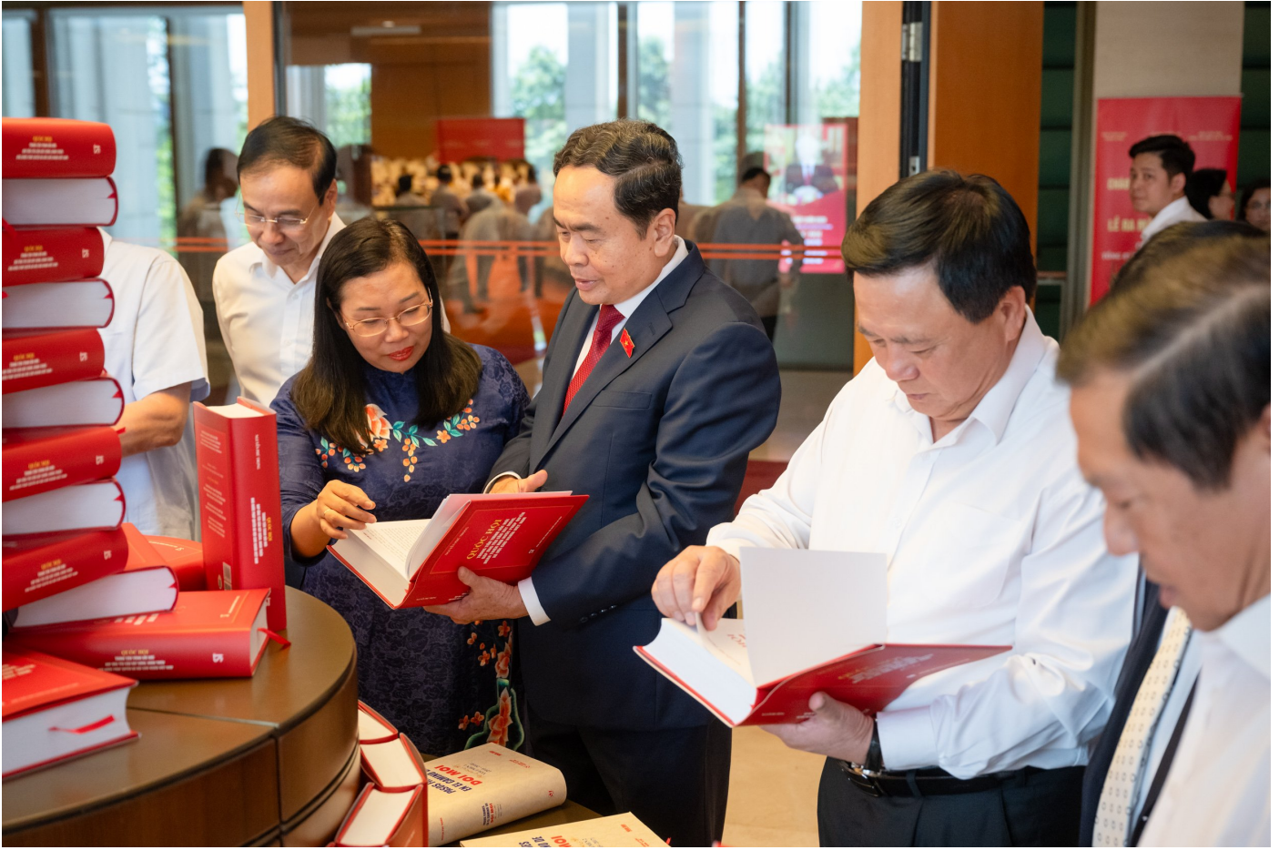
Chủ tịch Quốc hội Trần Thanh Mẫn cùng các đại biểu tại lễ ra mắt cuốn sách.