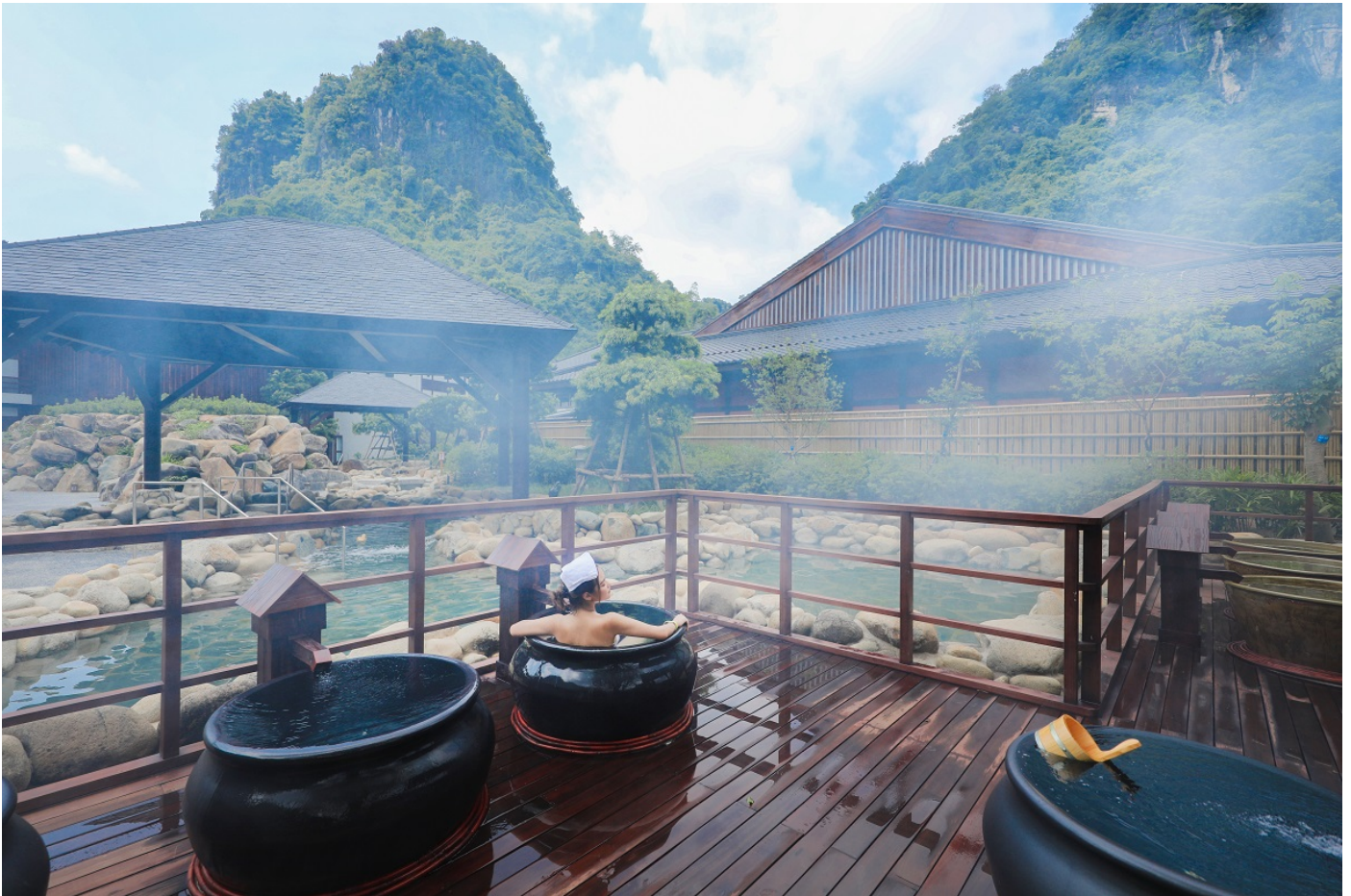
Yoko Onsen Quang Hanh nằm giữa cảnh quan thiên nhiên hùng vĩ

Khách quốc tế đến Vịnh Hạ Long có thể kết hợp nghỉ dưỡng sang trọng, tiện nghi tại khu nghỉ Oakwood Ha Long, tắm suối khoáng nóng và spa tại Yoko Onsen Quang Hanh, ghé thăm làng chài nổi Vung Viêng, lặn tắm biển tại Đảo Tuần Châu, trải nghiệm chợ đêm Hạ Long và thăm quan Bảo tàng Quảng Ninh.