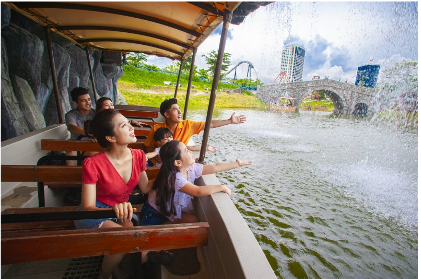
Tại đỉnh Ba Đèo, bên cạnh check-in tại Vườn Nhật, cầu Koi, du khách đến Sun World Ha Long vào