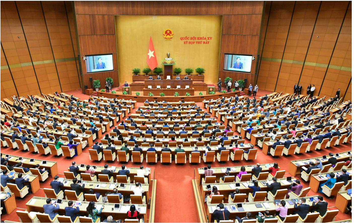
Toàn cảnh phiên khai mạc Kỳ họp thứ 7.

Phó Chủ tịch Thường trực Quốc hội cũng đề nghị các vị đại biểu Quốc hội quan tâm thảo luận, đóng góp ý về sự phù hợp, tính khả thi, hiệu quả của các chính sách; tính thống nhất, đồng bộ với các quy định của pháp luật hiện hành; bảo đảm phát huy được nguồn lực, tận dụng được cơ hội phát triển, hoàn thành tốt các mục tiêu, nhiệm vụ đã đề ra.