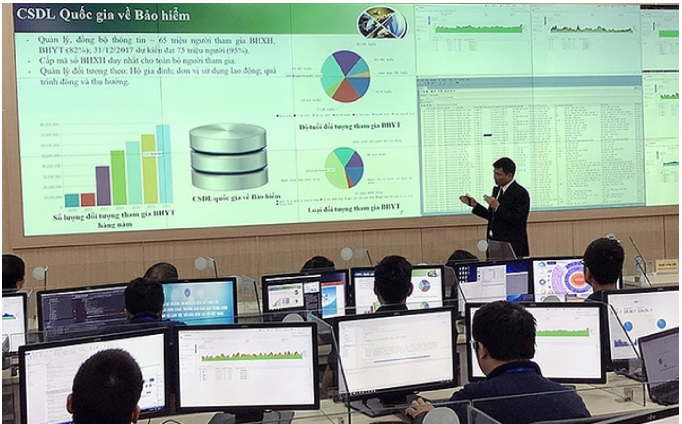
Xây dựng cơ sở dữ liệu quốc gia về bảo hiểm

Với quyết tâm kiến tạo, phát triển ngành BHXH Việt Nam hiện đại, chuyên nghiệp, vì sự hài lòng của người dân, doanh nghiệp (DN), thời gian qua, trên cơ sở nền tảng, hạ tầng công nghệ thông tin (CNTT) sẵn có, BHXH Việt Nam đã triển khai mạnh mẽ công tác chuyển đổi số theo tinh thần chỉ đạo của Chính phủ và trở thành một trong những Bộ, ngành đi đầu về xây dựng Chính phủ số. Các kết quả đạt được đã và đang phục vụ hiệu quả cho các hoạt động công tác của Ngành và đem lại rất nhiều lợi ích cho người tham gia, thụ hưởng chính sách.