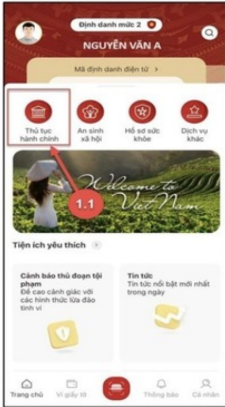
Hình 1 Màn hình chọn chức năng Thủ tục hành chính