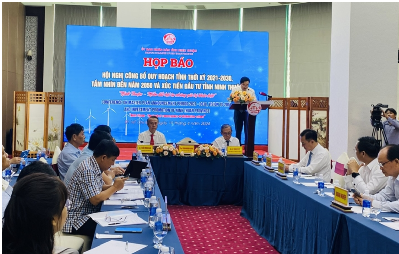
Quang cảnh buổi họp báo

Thông qua đó, Ninh Thuận mong muốn thu hút đầu tư, huy động các nguồn lực hiện thực hóa quy hoạch tỉnh; đồng thời, nâng cao vai trò, nhận thức của các cấp, các ngành, cộng đồng doanh nghiệp và người dân trong tổ chức thực hiện và giám sát việc thực hiện quy hoạch.