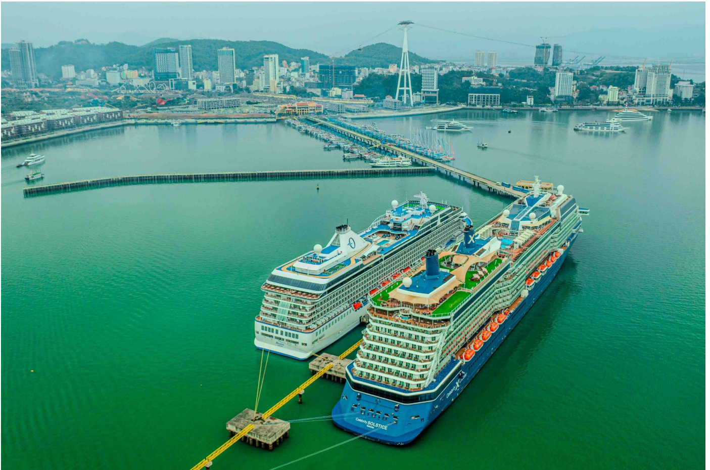
Cảng tàu khách quốc tế Hạ Long thường xuyên đón tàu khách quốc tế hạng sang

Cảng tàu khách du lịch quốc tế Hạ Long tọa lạc tại Bãi Cháy, Hạ Long, Quảng Ninh, là công trình cảng tàu khách du lịch quốc tế chuyên biệt đầu tiên trên cả nước. Công trình do Tập đoàn Sun Group đầu tư cũng đạt tiêu chuẩn quốc tế, đón tàu có tải trọng lớn nhất lên đến 225.000 GRT, với tổng số người lên đến 8.460 (gồm cả hành khách, thủy thủ đoàn), phục vụ được 2 tàu đậu cùng lúc. Dịch vụ văn minh, hạ tầng khang trang, hiện đại là những yếu tố hút khách trong, ngoài nước tìm đến khi bắt đầu hành trình đi thăm vịnh Hạ Long.