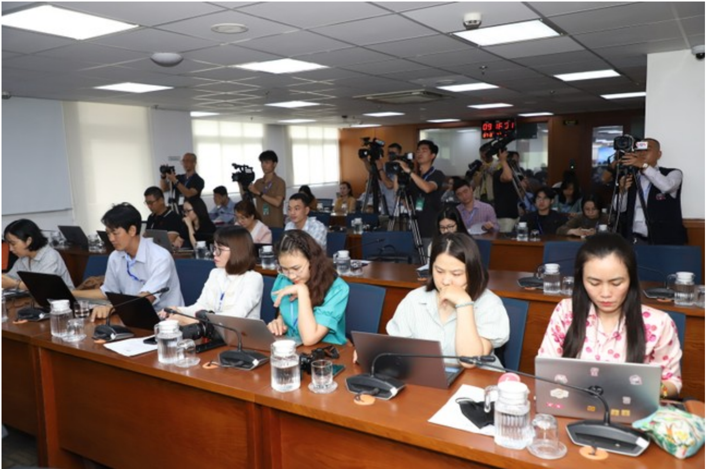
Quang cảnh buổi họp báo

ứng trực tiếp nhu cầu phát triển của các cơ quan báo chí... Năm nay, cùng với sự ủng hộ của Ủy ban nhân dân Thành phố Hồ Chí Minh, Hội Nhà báo Việt Nam quyết tâm lần đầu tiên đưa Hội Báo vào thành phố mang tên Bác, với mong muốn tạo điều kiện thuận lợi để các cấp Hội Nhà báo, các cơ quan báo chí và công chúng báo chí phía Nam có thể nhiệt tình tham dự, hòa vào niềm vui chung trong ngày hội của những người làm báo”.