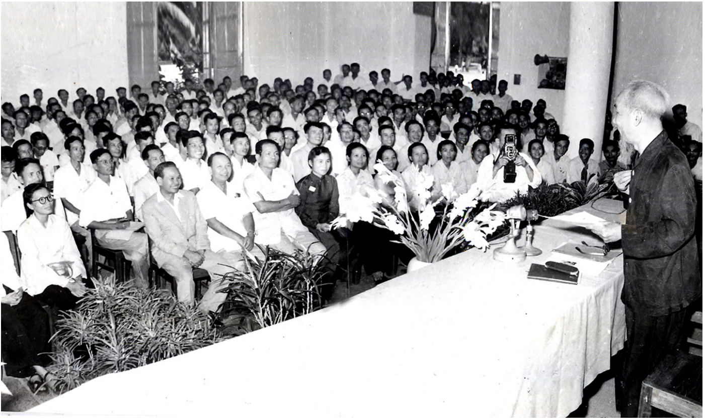
Chủ tịch Hồ Chí Minh với các nhà báo tại Đại hội III, Hội Nhà báo Việt Nam, năm 1962.

Bước vào giai đoạn phát triển và đổi mới đất nước, cùng với niềm tự hào “Đất nước ta chưa bao giờ có được cơ đồ, tiềm lực, vị thế và uy tín quốc tế như ngày nay”, chúng ta cũng đang đối mặt với nhiều nguy cơ, thách thức: Tình hình thế giới tiếp tục diễn biến phức tạp, mau lẹ và khó lường. Ở trong nước, kinh tế - xã hội phát triển vẫn chưa tương xứng với tiềm năng, lợi thế của đất nước. Đời sống văn hóa xã hội còn những biểu hiện thiếu lành mạnh. Sự suy thoái về tư tưởng chính trị, sự xuống cấp về đạo đức, tha hóa về lối sống của một bộ phận cán bộ, đảng viên vẫn chậm được ngăn chặn, đẩy lùi. Các thế lực phản động, thù địch lợi dụng internet, mạng xã hội để lan truyền các thông tin tiêu cực, xấu độc, xuyên tạc, kích động hòng chống phá về chính trị, tư tưởng, làm suy giảm niềm tin của nhân dân đối với Đảng và Nhà nước. Trước tình hình đó, báo chí cách mạng Việt Nam cần không ngừng phấn đấu thực hiện tốt nhiệm vụ nặng nề nhưng rất vẻ vang là thông tin, định hướng kịp thời đường lối, chủ trương của Đảng, chính sách pháp luật của Nhà nước, phản ánh, biểu dương khí thế của các tầng lớp Nhân dân ta đang đồng tâm, hiệp lực xây dựng Tổ quốc Việt Nam giàu mạnh, bảo vệ vững chắc độc lập, chủ quyền và toàn vẹn lãnh thổ. “Đây là bước phát triển rất đáng tự hào của báo chí cách mạng - đội quân xung kích trên mặt trận tư tưởng - văn hóa của Đảng ta”.