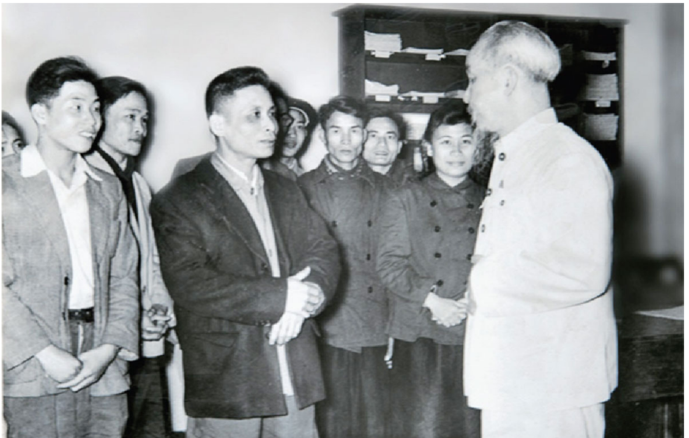
Bác Hồ thăm và chúc Tết cán bộ phóng viên Báo Nhân Dân năm 1957_Ảnh: Tư liệu

Dưới sự lãnh đạo của Đảng, nền báo chí cách mạng Việt Nam đã được xây dựng, phát triển nhằm thực hiện mục tiêu cao cả của cách mạng là giải phóng dân tộc và xây dựng xã hội chủ nghĩa. Vì thế, nền báo chí ấy gắn liền với số phận nhân dân, hoạt động vì nhân dân. Tính chất của nền báo chí ấy được định bởi cương lĩnh của Đảng, bởi mục tiêu của cách mạng mà Đảng lãnh đạo, tổ chức thực hiện, được khái quát bằng một câu: “Báo chí vừa là tiếng nói của Đảng, của Nhà nước, của các đoàn thể vừa là diễn đàn của nhân dân”. Ngay từ Nghị quyết Hội nghị Trung ương lần thứ 2 (tháng 3, năm 1931), Đảng đã khẳng định “Các báo của Đảng là những cơ quan liên lạc của Đảng và quần chúng lao khổ”. Tính nhân dân, tính dân tộc và hiện đại của nền báo chí nước ta được thể hiện từ nội dung đến hình thức, từ quy mô phát triển lẫn hình thức phát hành.