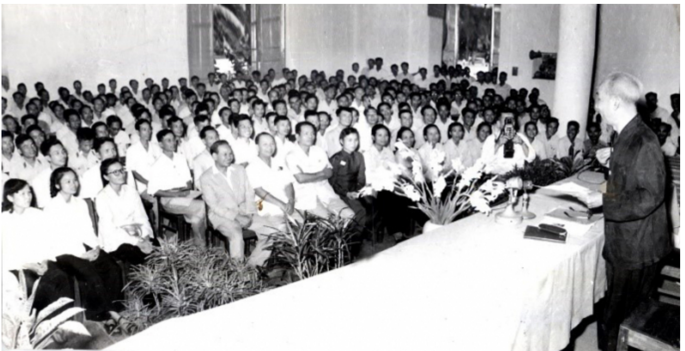
Chủ tịch Hồ Chí Minh nói chuyện với các đại biểu dự Đại hội lần thứ III, Hội Nhà báo Việt Nam

Sinh thời, Chủ tịch Hồ Chí Minh có nhiều định hướng xây dựng cho nền báo chí cách mạng nước nhà. Người cho rằng: Nhà báo cũng phải là chiến sĩ cách mạng, để làm tròn nhiệm vụ vẻ vang của mình, cán bộ báo chí cần phải tu dưỡng đạo đức cách mạng, cố gắng trau dồi tư tưởng, nghiệp vụ và văn hoá; chú trọng học tập chính trị để nắm vững chủ trương, chính sách của Đảng và Chính phủ; đi sâu vào thực tế, đi sâu vào quần chúng lao động. Điều lớn nhất kết tụ khát vọng của Người được để lại trong Di chúc đó là: “Toàn Đảng toàn dân ta đoàn kết phấn đấu, xây dựng một nước Việt Nam hòa bình, thống nhất, độc lập, dân chủ và giàu mạnh, và góp phần xứng đáng vào sự nghiệp cách mạng thế giới”. Khi nói chuyện với đội ngũ người làm báo ở Đại hội lần thứ III Hội Nhà báo Việt Nam tháng 9-1962, Người nói: “Cán bộ báo chí cũng là chiến sĩ cách mạng. Cây bút, trang viết là vũ khí sắc bén của họ”. Trong thư gửi anh em văn hoá và trí thức Nam bộ ngày 25-5-1947, Người viết: “Ngòi bút của các bạn cũng là những vũ khí sắc bén trong sự nghiệp phò chính, trừ tà”.