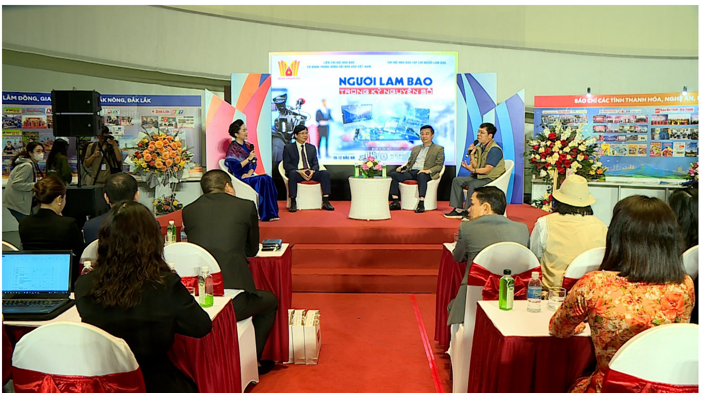
Talkshow "Người làm báo trong kỷ nguyên số" do Tạp chí Người Làm báo tổ chức tháng

Năm là, quy hoạch phát triển và quản lý báo chí đến năm 2025, kỷ niệm 100 năm Báo chí cách mạng Việt Nam, được xác định phát triển báo chí đi đôi với quản lý tốt, theo hướng cách mạng, chuyên nghiệp, hiện đại, chất lượng, hiệu quả đáp ứng nhu cầu thông tin của nhân dân, tuyên truyền đường lối của Đảng, chính sách, pháp luật của Nhà nước, đoàn kết tập hợp quần chúng, tạo sự đồng thuận trong xã hội, định hướng tư tưởng, góp phần nâng cao dân trí, phát triển văn hóa và con người Việt Nam trong kỷ nguyên số.