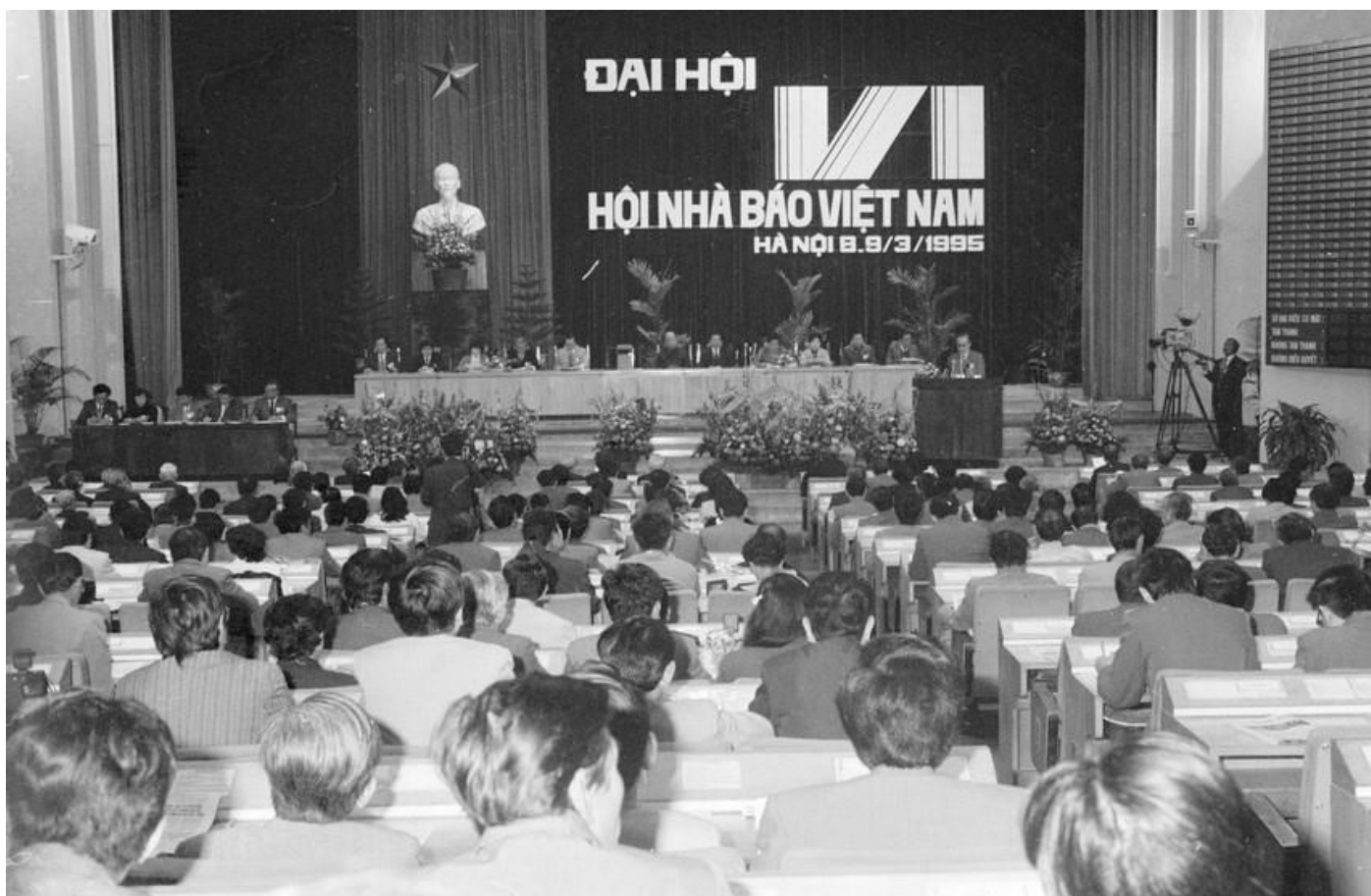
Quang cảnh phiên khai mạc Đại hội lần thứ VI Hội nhà báo Việt Nam diễn ra tại Hà Nội, từ ngày 8-9/3/1995

Trong quá trình lãnh đạo nhân dân tiến hành công cuộc đổi mới đất nước, trong từng giai đoạn, Đảng, Nhà nước ta đã có những bước chuyển quan trọng trong đổi mới tư duy, phong cách và phương thức lãnh đạo, quản lý đối với công tác báo chí. Chỉ thị số 63-CT/TW, ngày 25/7/1990 về tăng cường sự lãnh đạo của Đảng đối với công tác báo chí, xuất bản của Ban Bí thư Trung ương Đảng (khóa VI) đã cụ thể hóa Nghị quyết Đại hội VI của Đảng và được coi là văn kiện quan trọng đầu tiên nêu rõ nội dung, phương thức lãnh đạo của Đảng đối với báo chí. Chỉ thị xác định các công việc mà Đảng, Nhà nước cần thực hiện để lãnh đạo, quản lý báo chí; trách nhiệm của cơ quan chủ quản; trách nhiệm, quyền hạn của người phụ trách cơ quan báo chí và việc thành lập các tổ chức đảng trong các cơ quan báo chí... Ngày 17/10/1997 Bộ Chính trị (khóa VIII) ban hành Chỉ thị số 22-CT/TW về tiếp tục đổi mới và tăng cường sự lãnh đạo, quản lý công tác báo chí, xác định các quan điểm và định hướng, tăng cường thể chế hóa đường lối, nghị quyết của Đảng thành chính sách, pháp luật của Nhà nước trên lĩnh vực báo chí và xuất bản.