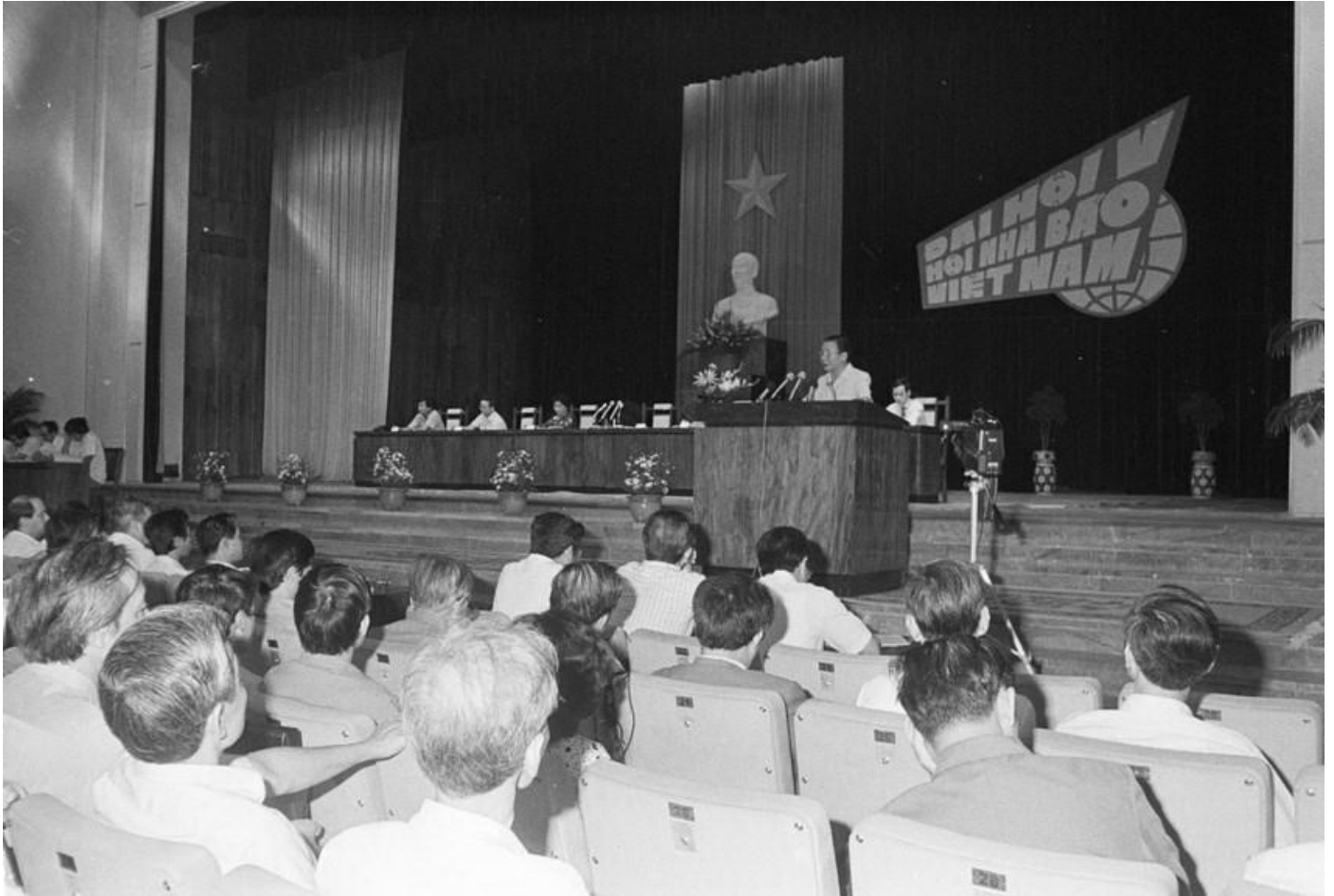
Đại hội V Hội Nhà báo Việt Nam, tổ chức tại hội trường Ba Đình (Hà Nội) tháng 10/1989

định nhiệm vụ trong tâm: “Phấn đấu đưa nền báo chí của ta phát triển ngang tầm cao cách mạng và kịp bước đi của thời đại”. Báo chí thời kỳ đổi mới do Đảng khởi xướng và lãnh đạo, mục tiêu của các kỳ Đại hội đã luôn bám sát nhiệm vụ cách mạng từng thời kỳ: “Đổi mới báo chí vì sự nghiệp đổi mới đất nước”. Đại hội lần thứ V, Hội Nhà báo Việt Nam, tháng 10/1989 “Báo chí vì sự nghiệp đổi mới và hiện đại hoá đất nước”. Đại hội lần thứ VI, tháng 3/1995 báo chí đã luôn bám sát mục tiêu con đường vì sự nghiệp đổi mới đất nước, cùng đất nước đi lên con đường CNXH.