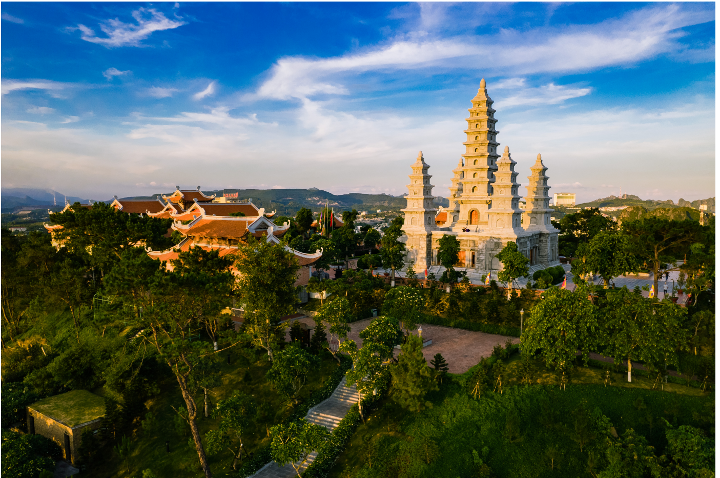
Bảo Hải Linh Thông Tự, Hạ Long, Quảng Ninh

An lạc trên miền đất Phật: Ngoài Vịnh Hạ long, nhắc đến Quảng Ninh người ta còn nghĩ ngay đến vùng đất phật với Yên Tử, Ngọa Vân, đền Cửa Ông hay Bảo Hải Linh Thông Tự linh thiêng. Về non thiêng mỗi độ thu sang đông về, du khách sẽ hưởng trọn nét tinh khôi của núi rừng, được tĩnh lặng lắng nghe chính mình, trong những bước chân an lạc trên hành trình tâm linh tại vùng đất thiêng. Đặc biệt từ mùa thu, tại Yên Tử sẽ là thời điểm diễn ra những nghi lễ quan trọng tưởng nhớ Phật hoàng Trần Nhân Tông. Bởi vậy du khách khi hành hương đến đây không chỉ là tìm về đất Phật mà còn để tu tâm dưỡng tính, để sống chậm lại giữa những hối hả thường ngày.