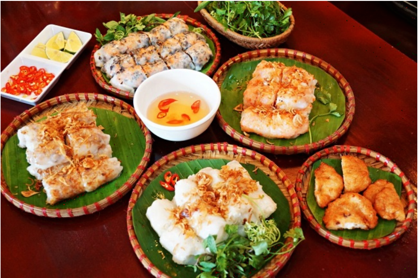
Bánh cuốn chả mực

Ăn quên lối về với đa dạng đặc sản: Được ví von như một “Việt Nam thu nhỏ” với đầy đủ biển, đồi núi và đồng bằng nên ẩm thực Quảng Ninh cũng phong phú và đa dạng bậc nhất cả nước. Những ngày đông lạnh giá, đừng ngại gì từ chối một tour “ăn trọn Quảng Ninh”. Ngoài các món ăn được chế biến từ hải sản như cù kỳ, bêche de mer, sá sùng, ngán, tôm, cua, cá, mực, ốc các loại... vốn là đặc trưng của vùng biển thì những món ăn sáng và ăn vặt nổi tiếng như bánh cuốn chả mực, cháo hà nóng hổi hay sữa chua trân châu ngon nức tiếng cả nước chắc chắn sẽ là lý do để bạn phải quay lại Quảng Ninh nhiều lần.