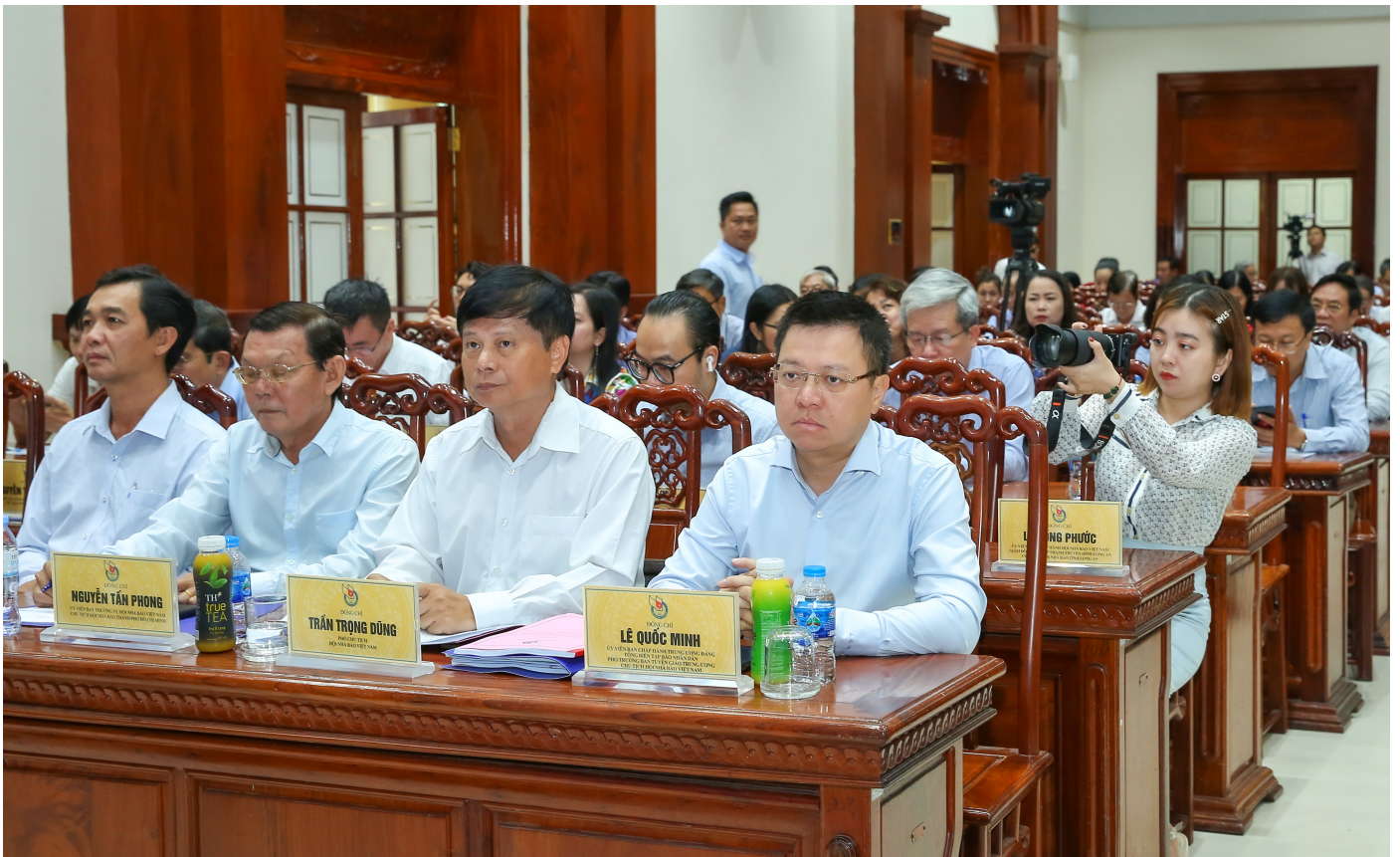
Các đồng chí lãnh đạo Hội Nhà báo Việt Nam tham dự hội nghị

đưa cuối năm... Qua đó, tạo sự chuyển biến mạnh mẽ về ý thức và hành động, tính tự tu dưỡng, rèn luyện, nâng cao đạo đức nghề nghiệp người làm báo, góp phần xây dựng đội ngũ người làm báo, hội viên gương mẫu, đoàn kết, chuyên nghiệp, nhân văn, tăng cường kỷ luật, kỷ cương, nâng cao chất lượng đội ngũ những người làm báo trong các cơ quan báo chí, chất lượng hội viên các cấp Hội; hướng tới xây dựng cơ quan Trung ương Hội, Hội Nhà báo tỉnh, thành phố, Liên Chi hội nhà báo, Chi hội nhà báo trực thuộc Hội Nhà báo Việt Nam, các cơ quan báo chí văn minh, hiện đại, xanh, sạch đẹp hướng tới thực hiện thắng lợi nhiệm vụ trọng tâm Hội Nhà báo Việt Nam: Đoàn kết, chuyên nghiệp, văn hóa, sáng tạo.