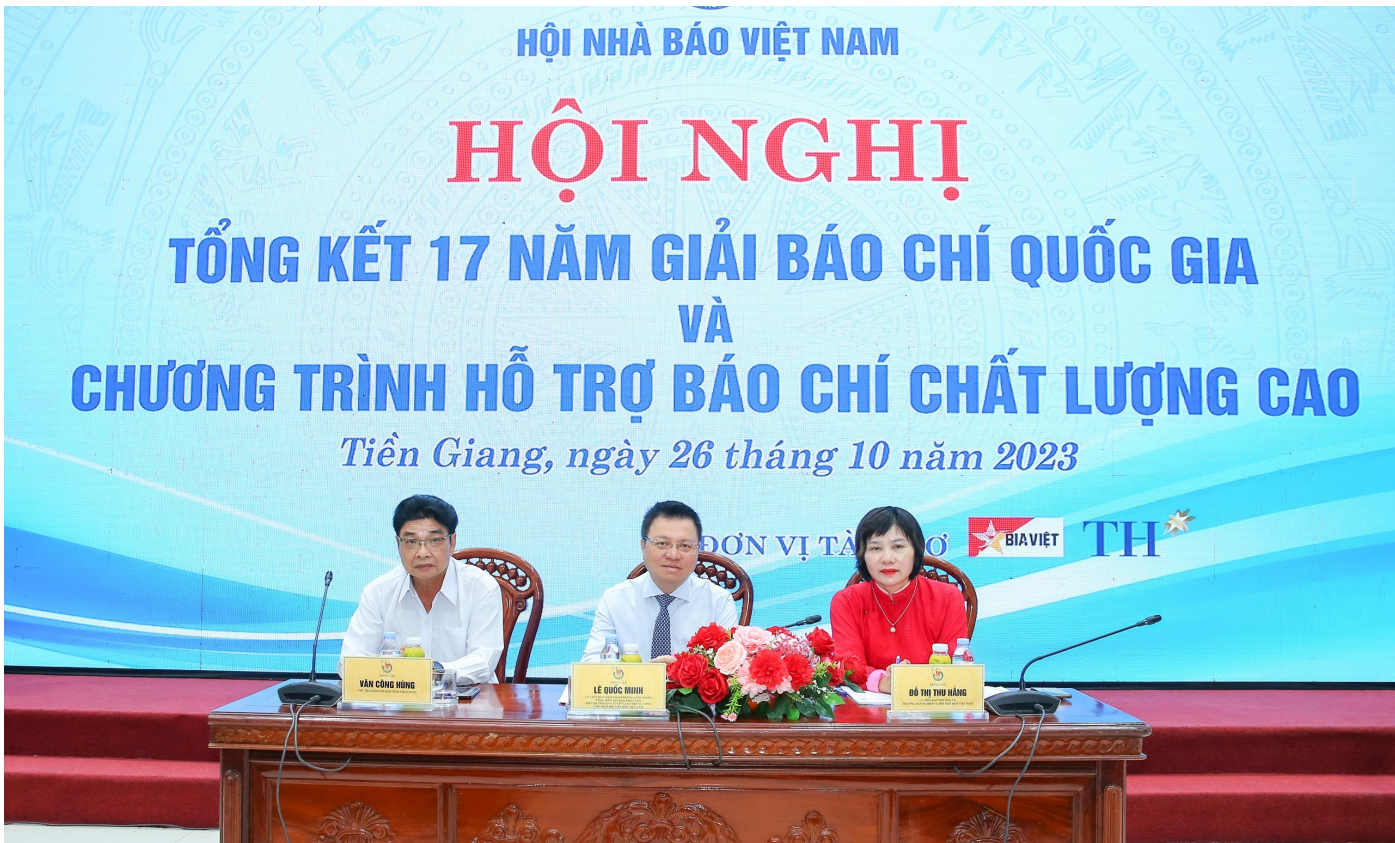
Các đồng chí chủ trì hội nghị

Ngày 26/10, tại TP. Mỹ Tho, tỉnh Tiền Giang, Hội Nhà báo Việt Nam tổ chức hội nghị tổng kết 17 năm Giải Báo chí Quốc gia và chương trình hỗ trợ báo chí chất lượng cao năm 2022; triển khai chương trình hỗ trợ báo chí chất lượng cao năm 2023 - 2024 đối với 19 tỉnh, thành khu vực phía Nam.