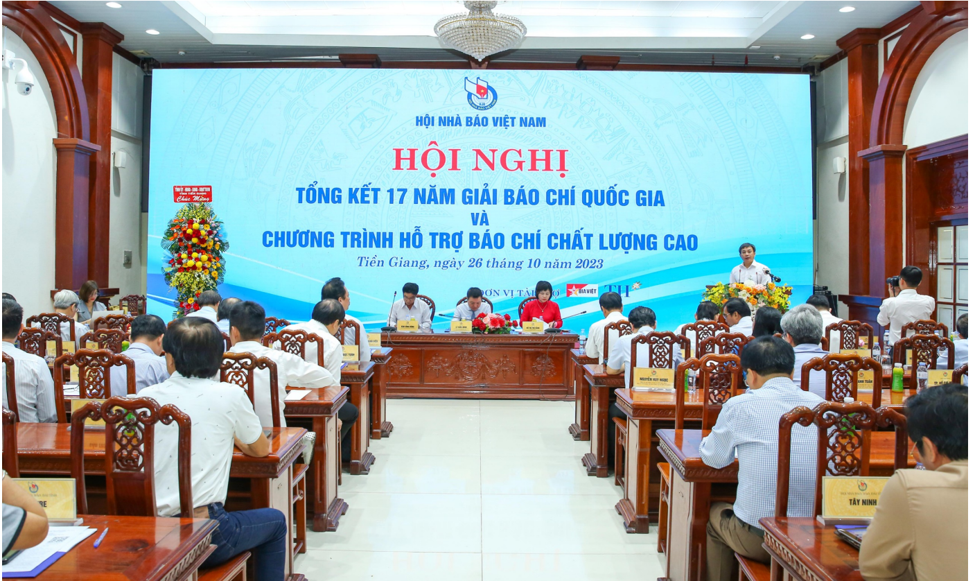
Quang cảnh hội nghị

xuất sắc đã đoạt giải báo chí quốc gia và các giải báo chí chuyên ngành. Qua hội nghị này, tiếp tục khẳng định, Chương trình hỗ trợ báo chí chất lượng cao đã được các cơ quan chuyên môn nghiệp vụ của Trung ương Hội Nhà báo Việt Nam triển khai rất thành công. Trước mắt, Hội Nhà báo Việt Nam ghi nhận các ý kiến và sẽ ban hành các quy định một cách khoa học hiệu quả đến các cấp Hội, đồng thời kiến nghị với Chính phủ, các cơ quan quản lý nhà nước đầu tư mạnh mẽ hơn nữa cho công tác hỗ trợ báo chí chất lượng cao trong giai đoạn tiếp theo.