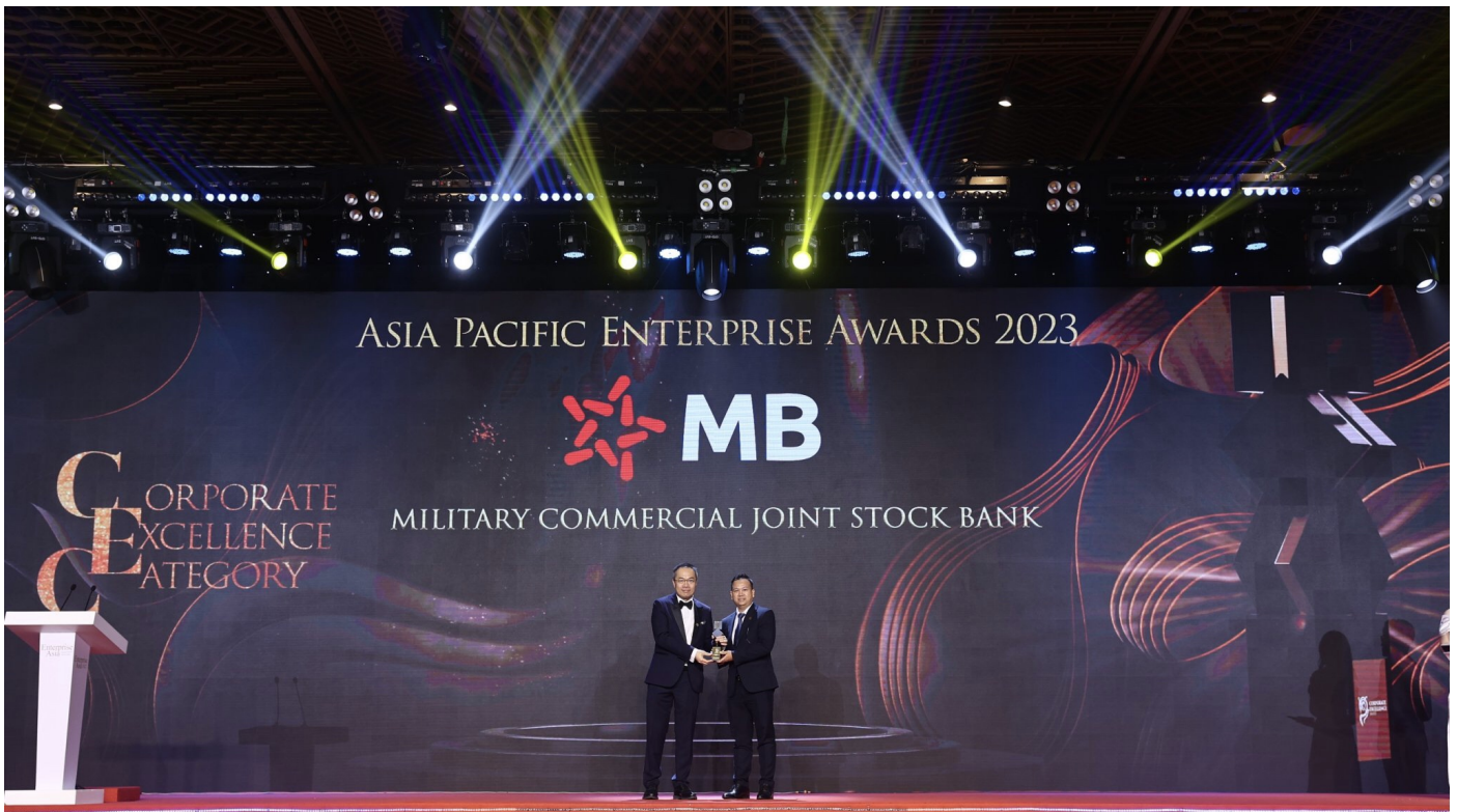
MB ghi danh ở hạng mục “Doanh nghiệp xuất sắc châu Á” năm 2023.

Nối tiếp các năm 2020, 2021 và 2022, năm nay, trong khuôn khổ giải thưởng Asia Pacific Enterprise Awards (APEA), MB tiếp tục được trao giải “Corporate Excellence Award” - Doanh nghiệp xuất sắc châu Á nhờ duy trì thực hiện tốt các mục tiêu kinh doanh theo kế hoạch đề ra, tăng trưởng ổn định và không ngừng mang đến những trải nghiệm thuận tiện nhất cho khách hàng.