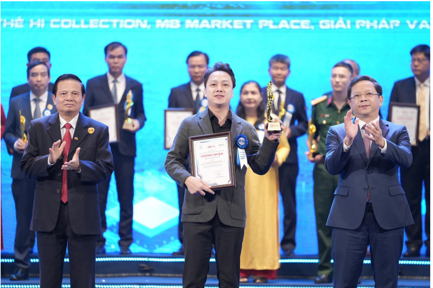
MB giành giải thưởng Chuyển đổi số Việt Nam 2023.

"Chia sẻ biến động số dư VietQR" hoàn toàn miễn phí trên App MBBank, đặc biệt hữu dụng đối với các chủ tiểu thương. Với tính năng này, chủ cửa hàng kinh doanh có thể chia sẻ biến động số dư đến tất cả nhân viên, đẩy nhanh thời gian thanh toán, thuận tiện hơn trong quản lý doanh thu mà vẫn đảm bảo tính an toàn, bảo mật cho tài khoản và tránh rủi ro trong giao dịch.