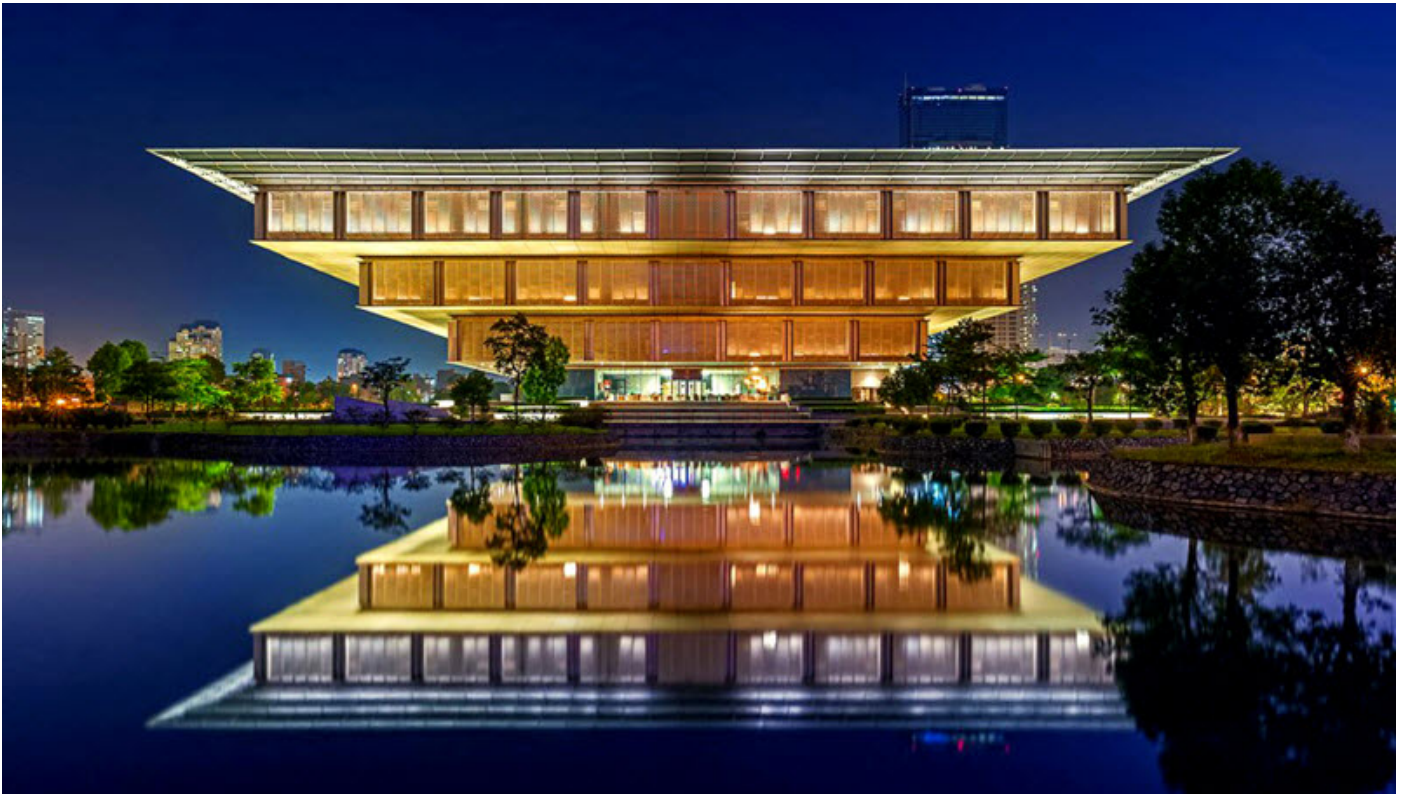
Bảo tàng Hà Nội, kiến trúc mới lạ giữa lòng Thủ đô

gốm Bát Tràng được hiện đại hóa trong nhiều khâu sản xuất nhưng nét cổ xưa trong họa tiết và hình dáng sản phẩm thì vẫn được lưu truyền, bên cạnh đó do giao lưu kinh tế văn hóa đông tây nên nhiều nhà sản xuất đáp ứng thị trường mà cho ra lò nhiều loại sản phẩm ảnh hưởng phong cách gốm Châu Âu, Nhật bản, Trung Quốc... Được cầm tay chỉ việc để tạo ra một chiếc gốm và gửi lò nung cũng là một trải nghiệm mà nhiều du khách lựa chọn.