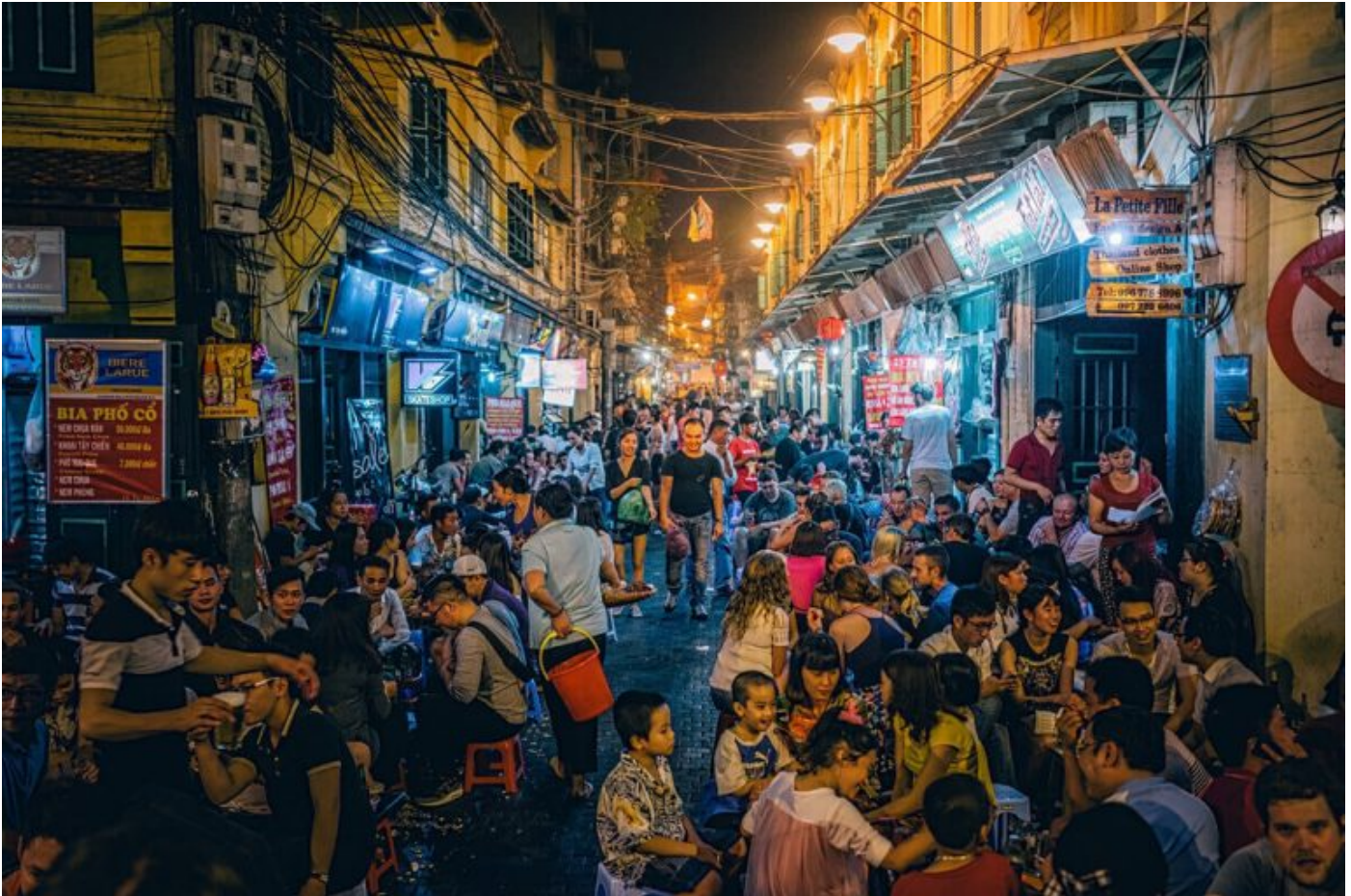
Góc nhỏ phố Tạ Hiện - một trong những tuyến phố thu hút nhiều khách du lịch

Dẫu không thanh lịch cũng người Tràng An.