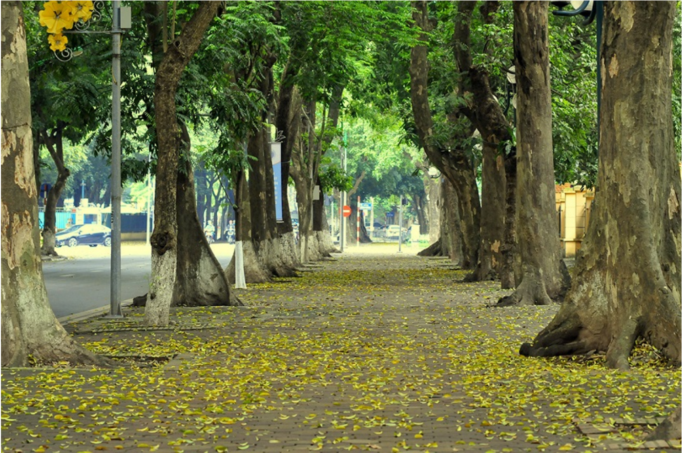
Con đường mùa thu của Hà Nội – đường Phan Đình Phùng

Trong Festival Thu Hà Nội năm 2023 còn diễn ra chương trình trình diễn trang phục áo dài “Trang phục áo dài đám cưới theo dòng thời gian”; trình diễn áo dài của Câu lạc bộ áo dài Việt Nam; trải nghiệm không gian cốm Hà Nội, di sản nghề may áo dài Trạch Xá. Điểm nhấn là Carnival Thu Hà Nội được dàn dựng công phu với quy mô 1500 người diễn ra vào sáng 1/10.