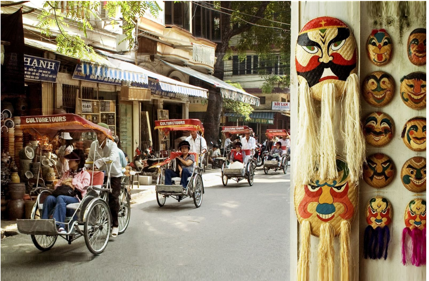
Hà Nội 36 phố phường

Trong cái không khí trầm mặc cổ xưa ấy du khách hãy ghé chân thưởng thức bữa cơm truyền thống của người Hà nội xưa tại nhà hàng “Cơm Phố cổ” ở phố Nguyễn Siêu, một địa chỉ ghé chân của nhiều du khách trong nước và quốc tế. Không gian ấm cúng, đậm văn hóa xưa từ phong vị món ăn đến phong cách kiến trúc cổ sân vườn. Với món ăn đa dạng theo mùa, từ giản dị đến tinh tế... Giá cả hợp lý, phục vụ nhẹ nhàng nên đây là địa chỉ lựa chọn của nhiều thực khách khi muốn trải nghiệm món ăn truyền thống đất Hà Thành xưa.