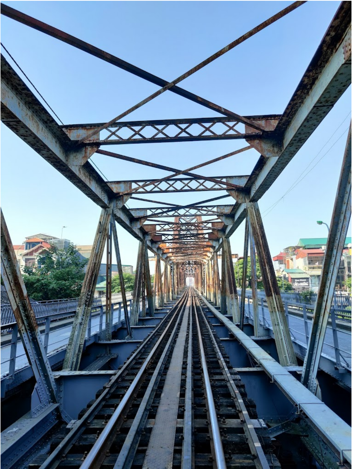
Cầu Long Biên - công trình lịch sử gắn với mảnh đất Thủ đô từ thời Pháp thuộc_Ảnh: ST