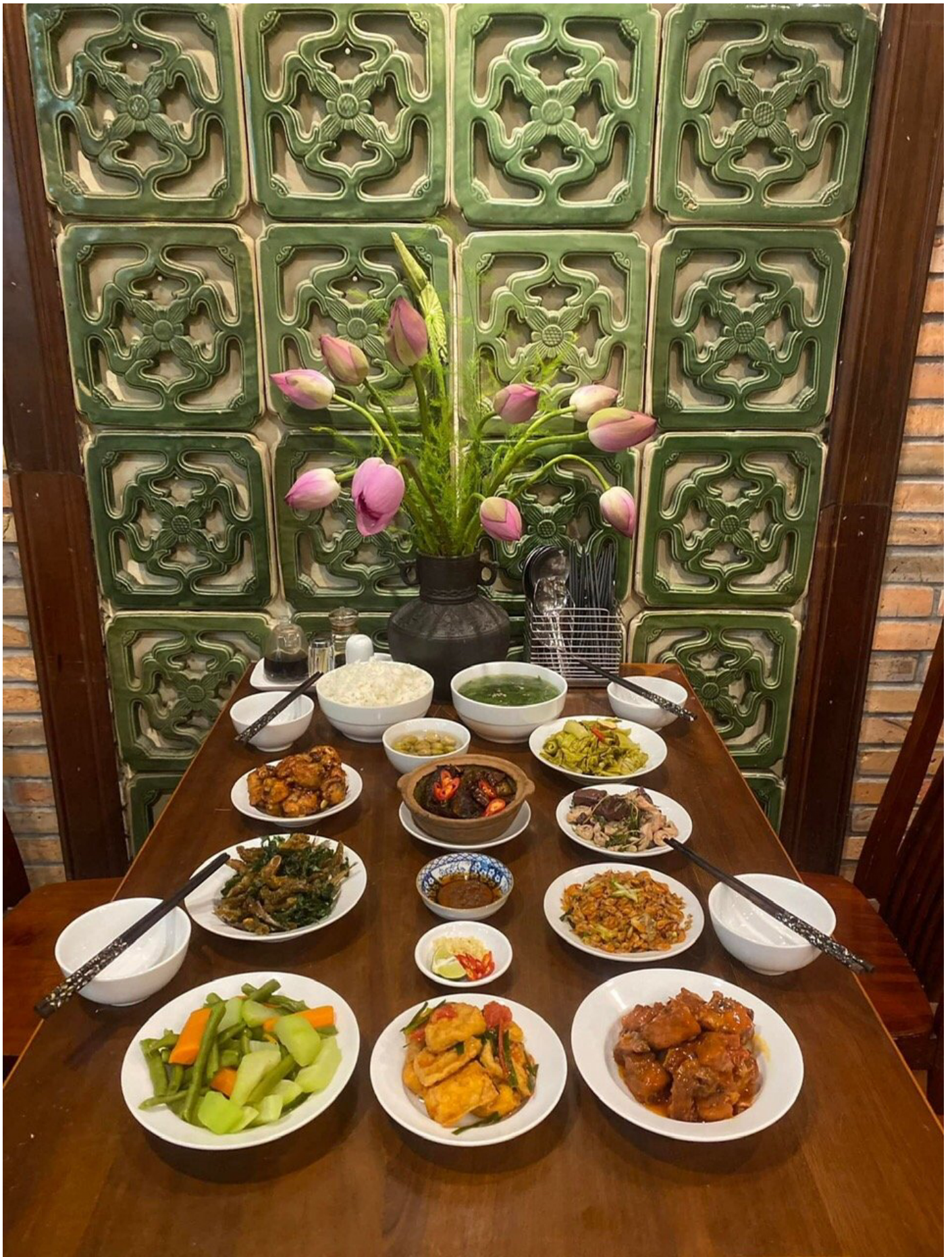
Trải nghiệm những món ăn truyền thống