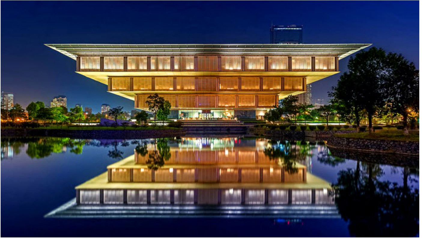
Bảo tàng Hà Nội, kiến trúc mới lạ giữa lòng Thủ đô

gốm Bát Tràng được hiện đại hóa trong nhiều khâu sản xuất nhưng nét cổ xưa trong họa tiết và hình dáng sản phẩm thì vẫn được lưu truyền, bên cạnh đó do giao lưu kinh tế văn hóa đông tây nên nhiều nhà sản xuất đáp ứng thị trường mà cho ra lò nhiều loại sản phẩm ảnh hưởng phong cách gốm Châu Âu, Nhật bản, Trung Quốc... Được cầm tay chỉ việc để tạo ra một chiếc gốm và gửi lò nung cũng là một trải nghiệm mà nhiều du khách lựa chọn.