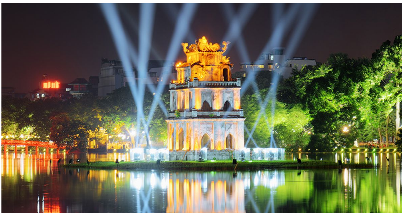
Hồ Hoàn Kiếm - trái tim của Thủ đô

Có một mùa trong năm mang đến cho tâm hồn ta nhiều thứ thái, lãng mạn hơn cả là mùa Thu. Khi gió bắt đầu nhẹ hơn, nắng rớt vàng như mật trên những tán cây già là lúc tâm hồn con người cũng lắng đọng thứ thái hơn bao giờ hết. Nó như một nốt trầm trong bản nhạc thời gian, một khoảng lặng để ai đó thấy rõ hơn lòng mình cũng như thấu rõ nỗi niềm trời đất thiên nhiên khi sang mùa. Đặc biệt hơn là mùa Thu Hà Nội, cũng cái tiết hanh hanh hao hao ấy nhưng nhập vào hồn cốt Thủ đô ngàn năm văn hiến dường như mùa thu cũng thanh tao hơn, dịu dàng hơn, có gì đó man mác buồn trong những phiêu pha, lại có chút rộn ràng trong những niềm mới lạ do sự giao thoa văn hóa đông tây ấy. Festival Thu Hà Nội, điểm đến cho mùa Thu năm nay có gì thu hút bạn?