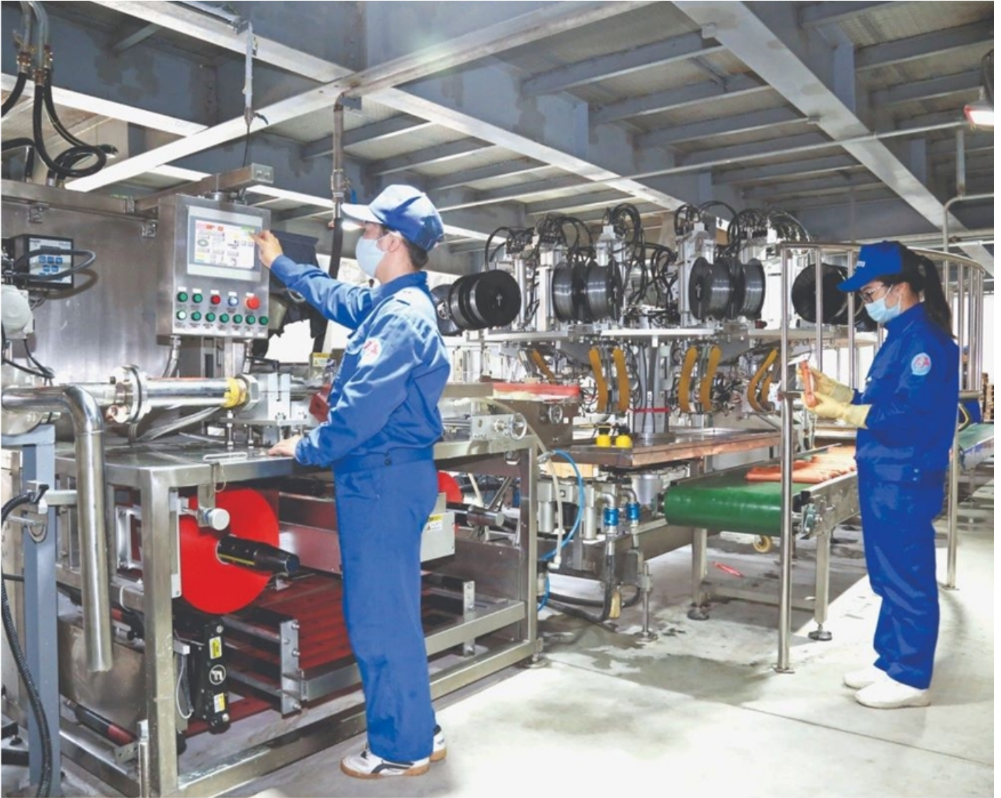
Làm chủ hệ thống thiết bị mới tại Nhà máy Z113, Tổng cục Công nghiệp quốc phòng

tin thần; đồng thời tăng cường tập huấn, đẩy mạnh hợp tác trong đào tạo, bồi dưỡng cán bộ, nhân viên; có cơ chế khuyến khích sáng kiến, nghiên cứu khoa học, đổi mới, sáng tạo... nguồn nhân lực hoạt động trực tiếp trong ngành CNQP đã không ngừng lớn mạnh, phát triển cả về số lượng và chất lượng, tiến bộ cả về trình độ, năng lực cũng như phẩm chất chính trị, đáp ứng được yêu cầu của sản xuất quốc phòng trong mọi tình huống.