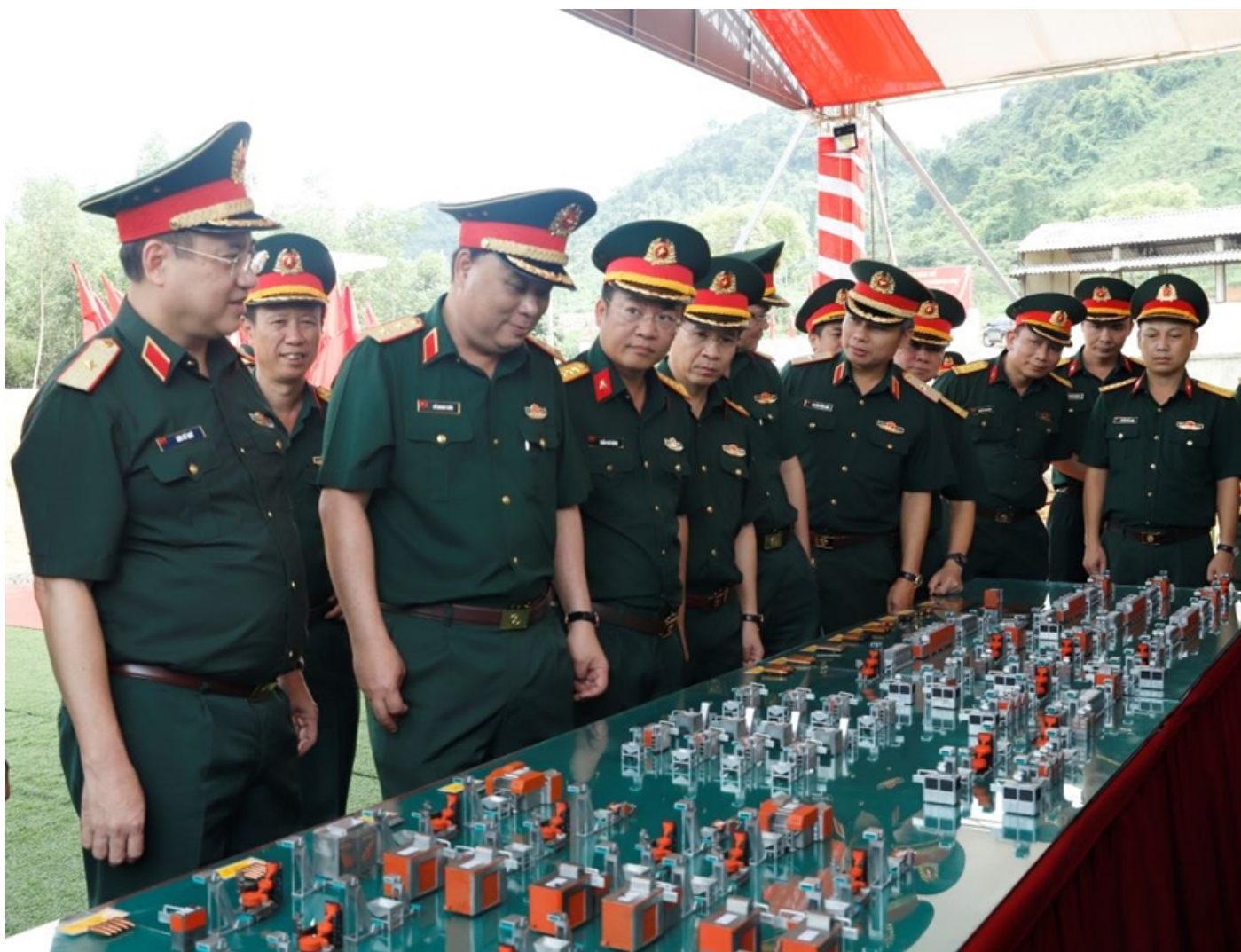
Thủ trưởng Tổng cục Công nghiệp quốc phòng và các cơ quan của Bộ Quốc phòng kiểm tra mô hình dự án tại đơn vị.