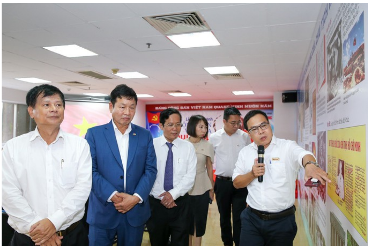
Đoàn tham quan tòa soạn Báo Người Lao Động

Tiếp nối phần trình bày tham luận của các đơn vị, ông Lê Quốc Minh, Ủy viên Trung ương Đảng, Phó Trưởng Ban Tuyên giáo Trung ương, Tổng Biên tập Báo Nhân Dân, Chủ tịch Hội Nhà báo Việt Nam và ông Trương Gia Bình, Chủ tịch Tập đoàn FPT điều phối hoạt động thảo luận với những phần hỏi - đáp cùng các đại biểu tham dự chương trình. Các vấn đề như bản quyền, quảng cáo trên báo chí, giải pháp công nghệ như nền tảng sử dụng chung, công cụ đánh giá, ... được các đại biểu đặt ra với những trăn trở và khó khăn đang đối mặt, từ đó đề xuất mong muốn, giải pháp để sớm khắc phục hạn chế đang tồn tại và thúc đẩy quá trình chuyển đổi số nhanh chóng, đồng bộ.