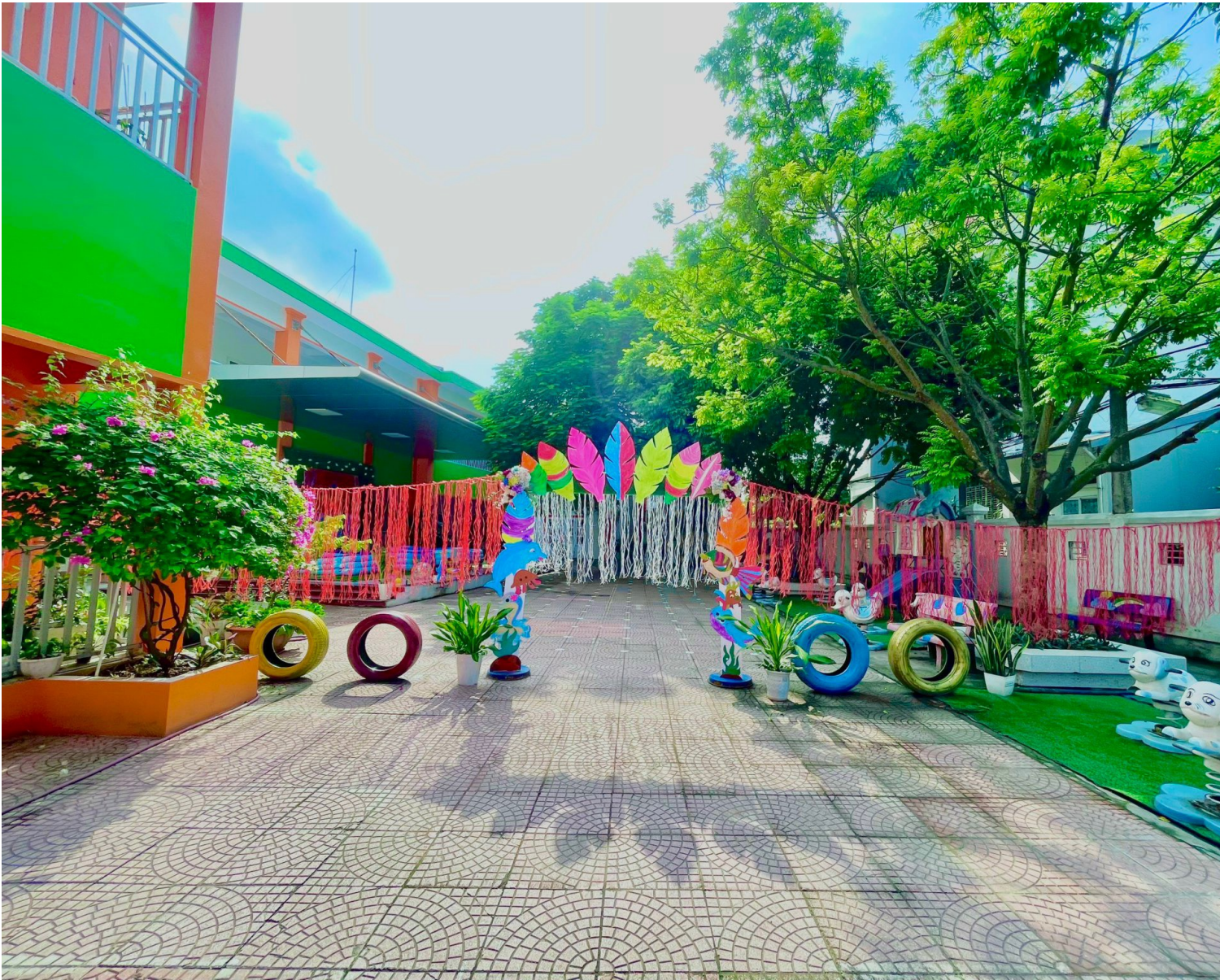
Không gian vui chơi ngoài trời của Trường Mầm non Bắc Cầu.

Trong sắc nắng vàng rực rỡ của mùa thu Hà Nội, cô và trò của nhà trường đã mở đầu Lễ khai giảng bằng nghi thức đón hơn 50 bé ở các độ tuổi vào trường, nâng tổng số học sinh của nhà trường lên hơn 200 học sinh. Với các bé và cả gia đình của các con, hôm nay là một ngày thật đặc biệt. Kể từ đây, các bé đã chính thức bước vào một trong những dấu mốc mới quan trọng trong hành trình học tập và rèn luyện của mình.