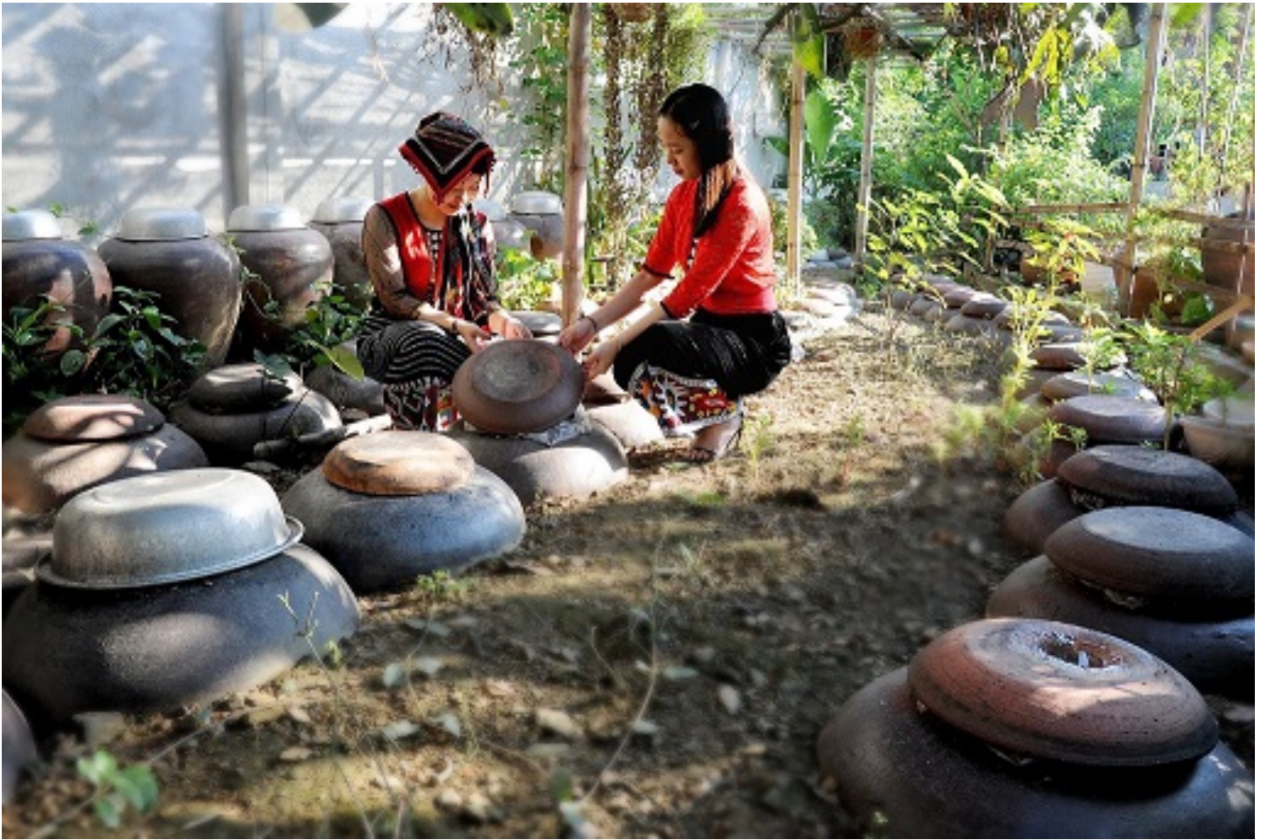
Rượu men lá ủ dưới đất – một sản phẩm du lịch được du khách yêu thích

Làm nên điều khác biệt của Con Cuông là phát triển du lịch cộng đồng. Năm 2016 sau khi triển khai dự án ‘Đa dạng hoá sinh kế dựa vào các làng nông, lâm, ngư nghiệp (DICA)’, nhiều người dân đồng bào dân tộc thiểu số đã biết làm du lịch cộng đồng. Hiện nay cả huyện có 4 điểm du lịch cộng đồng: bản Khe Rạn xã Bồng Khê, bản Nưa, bản Kha xã Yên Khê và bản Xiềng xã Môn Sơn. Các tổ dịch vụ như lưu trú, ẩm thực, văn nghệ được thành lập với sự tham gia của gần 100 người. Đây là những địa phương có đường giao thông thuận tiện, khí hậu trong lành, mát mẻ và cảnh đẹp thiên nhiên thơ mộng. Làng Thái cổ với nhiều nếp nhà sàn truyền thống cùng với nghề đan lát và dệt thổ cẩm.