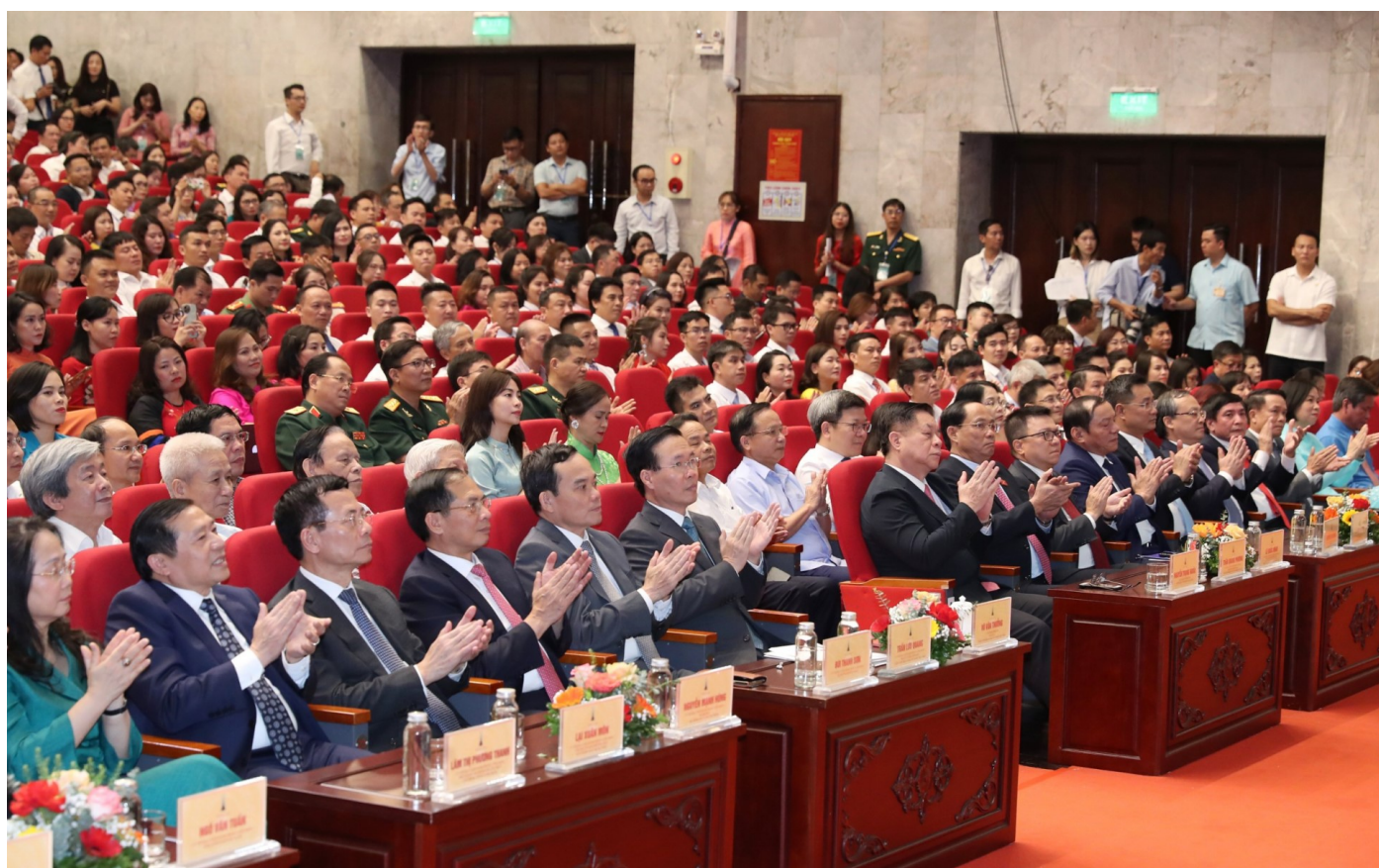
Các đại biểu tham dự lễ trao giải.

Giải báo chí Quốc gia là giải thưởng cao quý nhất dành tặng các tác phẩm báo chí xuất sắc, có đóng góp tích cực cho sự nghiệp báo chí nước nhà, tôn vinh các tác giả, nhóm tác giả có tác phẩm xuất sắc nhất trong năm.