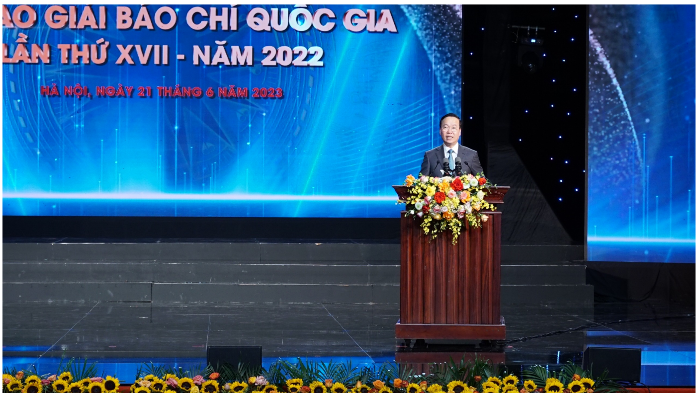
Chủ tịch nước Võ Văn Thưởng phát biểu tại lễ trao giải.

Nói về Giải báo chí Quốc gia, Chủ tịch nước cho biết, "Tôi đánh giá cao các tác phẩm đoạt Giải năm nay đã tiếp tục khẳng định tính cách mạng, tính khoa học, sự nhạy bén, sức sáng tạo, lý tưởng nghề nghiệp cao đẹp và sự dấn thân không mệt mỏi của các nhà báo. Các tác phẩm báo chí đã có sự đầu tư nghiêm túc, công phu, nhiều cách thức thể hiện sáng tạo, sinh động, hấp dẫn công chúng, thể hiện rõ năng lực chuyển đổi số và đổi mới sáng tạo báo chí. Nhiều tác phẩm báo chí mang tính phát hiện, tính chiến đấu cao, sắc bén, phản biện khoa học, đề xuất giải pháp thiết thực, thông tin tích cực, có sức lan tỏa, lay động, truyền cảm hứng mạnh mẽ trong xã hội".