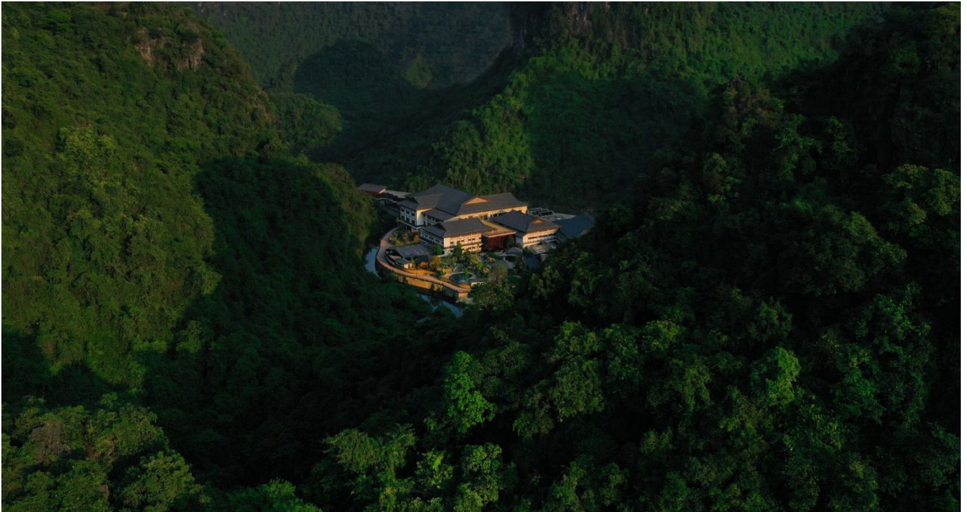
Khu nghỉ dưỡng Yoko Onsen Quang Hanh được bao bọc bởi núi rừng Quảng Ninh.

Nhưng liệu những thách thức có dừng lại sau khi đại dịch đã qua đi? Tại các vùng Địa Trung Hải và Carribe, bất chấp tài nguyên thiên nhiên giàu có, đều đang đổ thêm nhiều tỷ USD để phát triển các sản phẩm du lịch mới.