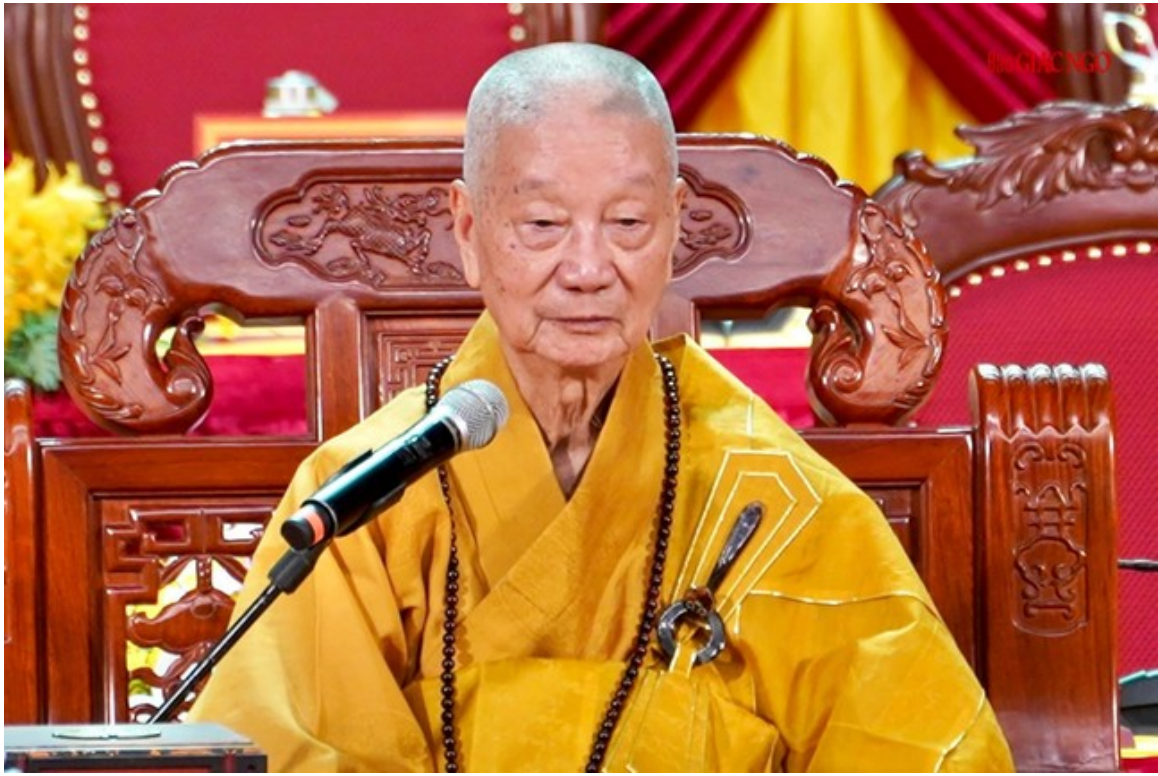
Trưởng lão Hoà thượng Thích Trí Quang, Ủy viên Pháp chế Giáo hội Phật giáo Việt Nam.

Trưởng lão Hoà thượng Thích Trí Quang, Ủy viên Pháp chế Giáo hội Phật giáo Việt Nam chia sẻ: “Đòn kìm trong giáo hội, tôi có xây dựng công lý trên xu hướng đời, hòa hợp trong Giáo pháp. Tôi trí tuệ và khả năng là quan trọng để phát triển bền vững. Tiếp tục việc làm tốt, sống tốt để trở thành nhân tố tốt trong xã hội. Nếu không có nhân tài, không có con người tiêu biểu thì không phát triển... Tôi cần mọi người chúng ta tìm ra nhân tố đó, nên cần, và tu học để các trưởng lão, phát hiện và mọi việc cùng giáo hội cùng phát triển. Tiếp tục sự nghiệp học của chúng ta để tìm ra nhân tài.”