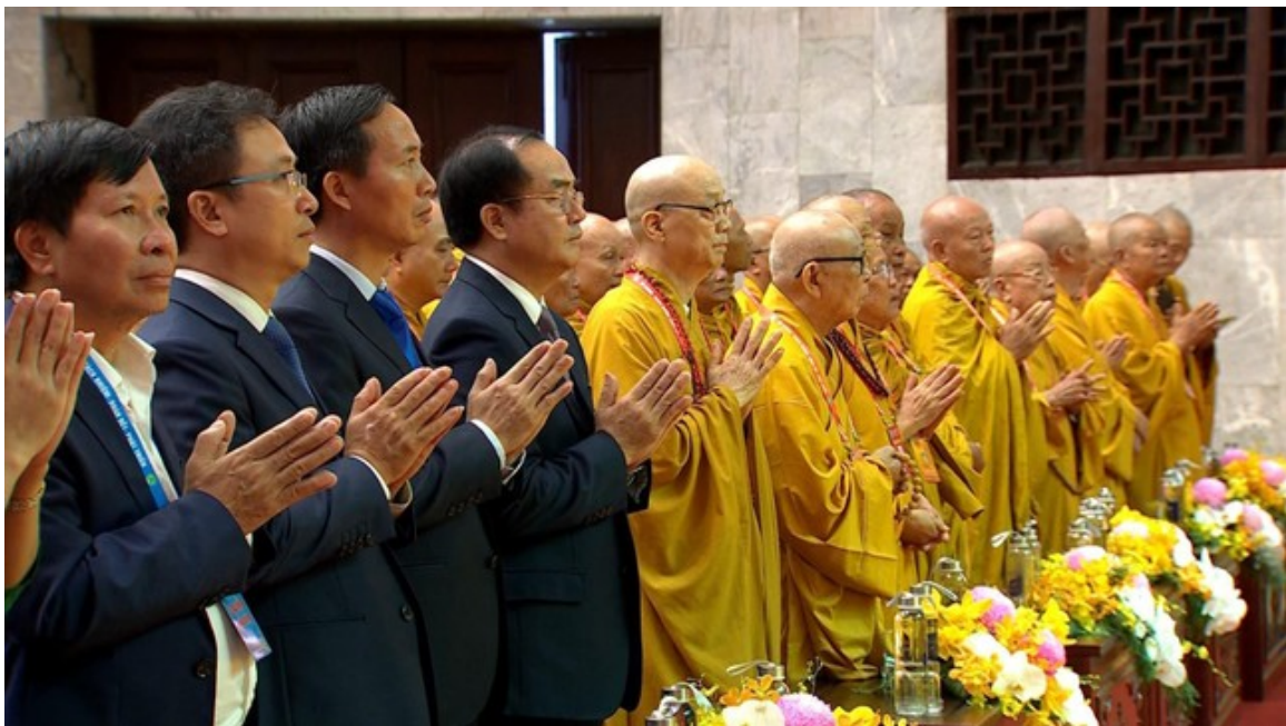
Các ??i bi?u tham d? phiên b? m?c.