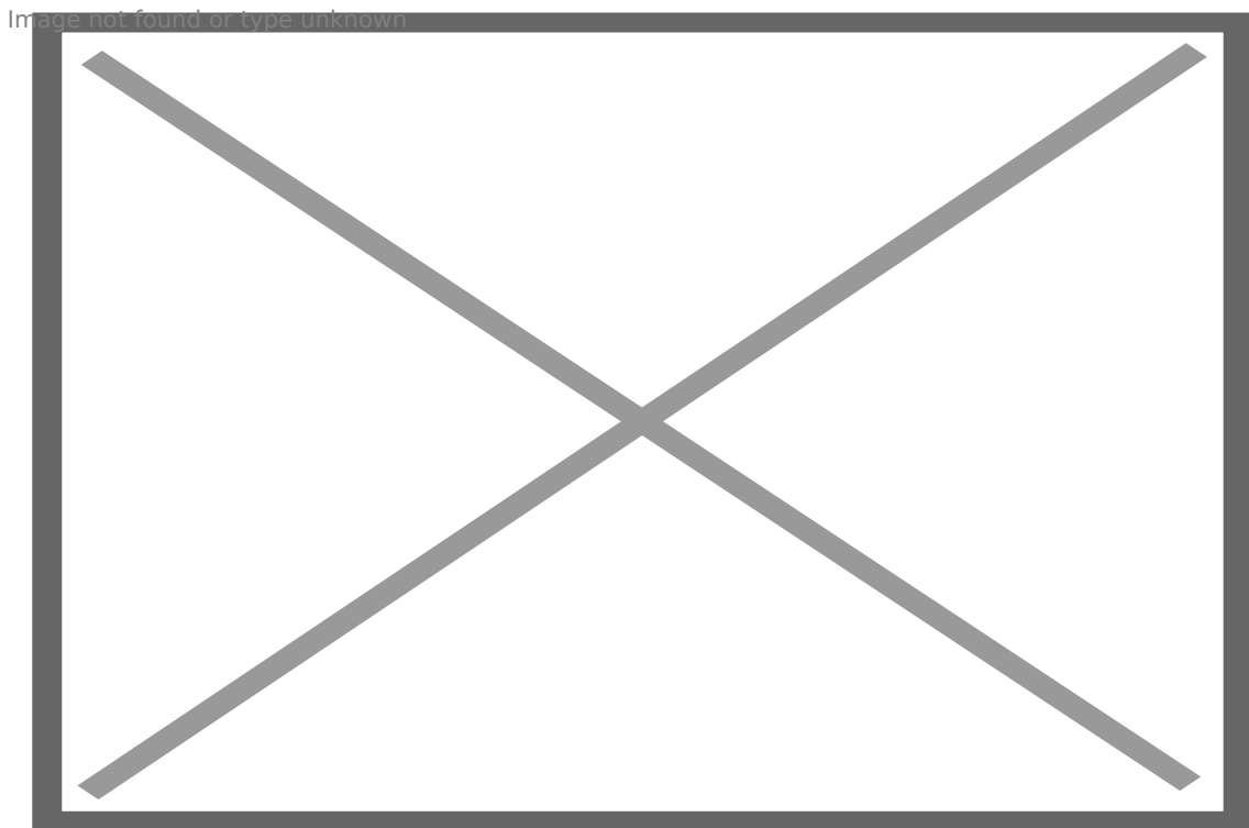
Đại diện Ban Lãnh đạo BIDV tại Sự kiện ra mắt Omni BIDV iBank

Nhân dịp ra mắt Omni BIDV iBank, BIDV dành tặng khách hàng doanh nghiệp chương trình ưu đãi mang tên “Omni iBank: Một điểm chạm – Ngân ưu đãi”. Theo đó, các khách hàng doanh nghiệp có số lượng giao dịch tài chính qua BIDV iBank lớn nhất trong tháng, trong đó có tối thiểu 30% giao dịch thực hiện tại Mobile app, sẽ nhận được phần thưởng là 01 Macbook Air trị giá 25 triệu đồng/khách hàng. Chương trình kéo dài từ tháng 6 đến tháng 11/2022.