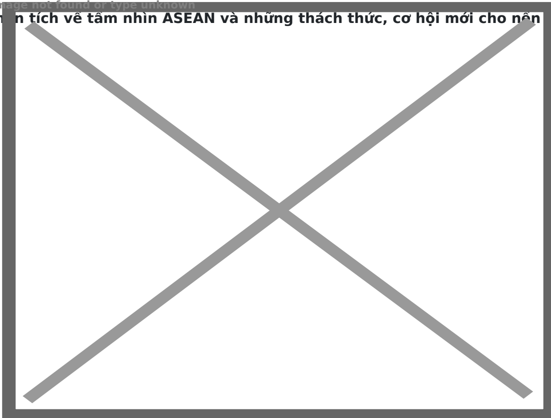
Quang cảnh hội

Hội thảo báo chí ASEAN: Những góc nhìn so sánh do Trường đại học KHXH&NV - Đại học Quốc gia Hà Nội phối hợp với Viện KAS (CHLB Đức) tổ chức sáng 19/10 tại Hà Nội đã phân tích về tầm nhìn ASEAN và những thách thức, cơ hội mới cho nền báo chí khu vực.