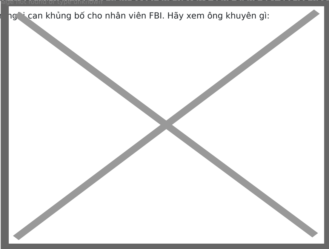
Một cuộc tranh

thật. Trước khi nghỉ hưu vào năm 2003, ông Navarro cũng giảng dạy các lớp học về kỹ năng thẩm vấn người can khủng bố cho nhân viên FBI. Hãy xem ông khuyên gì: