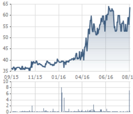
Biến động giá cổ phiếu TAC trong 1 năm

Báo cáo tài chính quý 2 của KIDO cũng đề cập đến việc công ty đã tạm ứng gần 440 tỷ đồng để tìm mua cổ phiếu TAC.