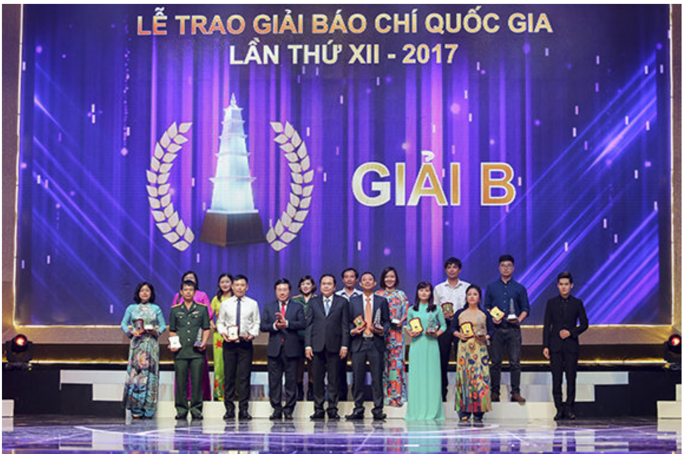
Phó Thủ tướng Phạm Bình Minh và Chủ tịch Ủy ban Trung ương MTTQ Việt Nam chụp ảnh lưu niệm với các tác giả đoạt giải B.

Hội Báo toàn quốc 2018 là sân chơi bổ ích nhằm tăng cường giao lưu giữa những người cầm bút và công chúng, qua đó khích lệ báo chí làm tốt chức năng, nhiệm vụ của mình, đáp ứng nhu cầu thông tin ngày càng cao của nhân dân, đồng thời góp phần nâng tầm vị thế của báo chí Việt Nam, uy tín của Hội Nhà báo Việt Nam trong bối cảnh hiện nay. Hội báo cũng là dịp để giới báo chí lắng nghe ý kiến nhận xét, đóng góp phê bình của công chúng, từ đó các nhà báo có thể trao đổi học hỏi lẫn nhau, không ngừng nâng cao trình độ nghiệp vụ và đạo đức nghề nghiệp người làm báo.