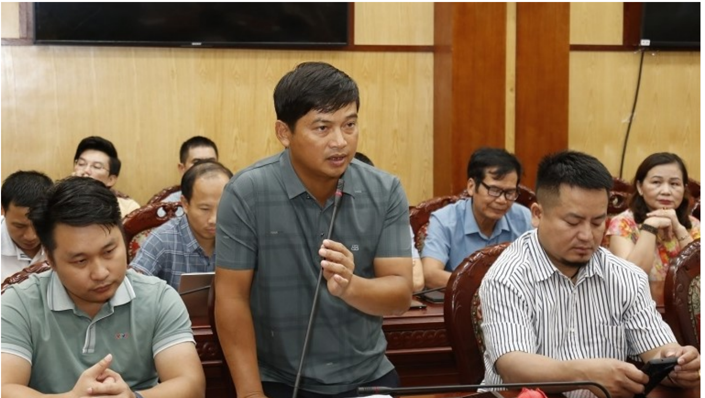
Các cơ quan báo chí phát biểu