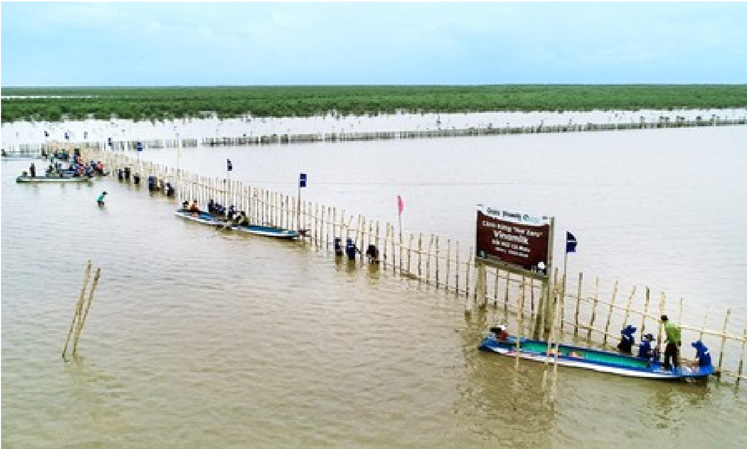
Đoàn lãnh đạo và nhân viên Vinamilk tham gia khoanh nuôi xúc tiến tái sinh 25ha rừng ngập mặn tại Cà Mau hồi tháng 8/2023

Song song với quá trình kiểm soát tối đa lượng phát thải, Vinamilk đang nỗ lực tạo ra những “bể chứa” carbon thông qua việc duy trì và phát triển quỹ cây xanh. Từ năm 2012, Vinamilk đã triển khai quỹ 1 triệu cây xanh cho Việt Nam và đã hoàn thành trồng 1.121.000 cây vào cuối năm 2020. Năm 2023, doanh nghiệp tiếp tục phối hợp cùng với Bộ Tài nguyên và Môi trường khởi động hoạt động trồng xây hướng đến Net Zero với ngân sách 15 tỷ đồng cũng như triển khai dự án khoanh nuôi xúc tiến tái sinh tự nhiên 25 ha rừng ngập mặn tại vườn quốc gia Mũi Cà Mau với chi phí gần 4 tỷ đồng.