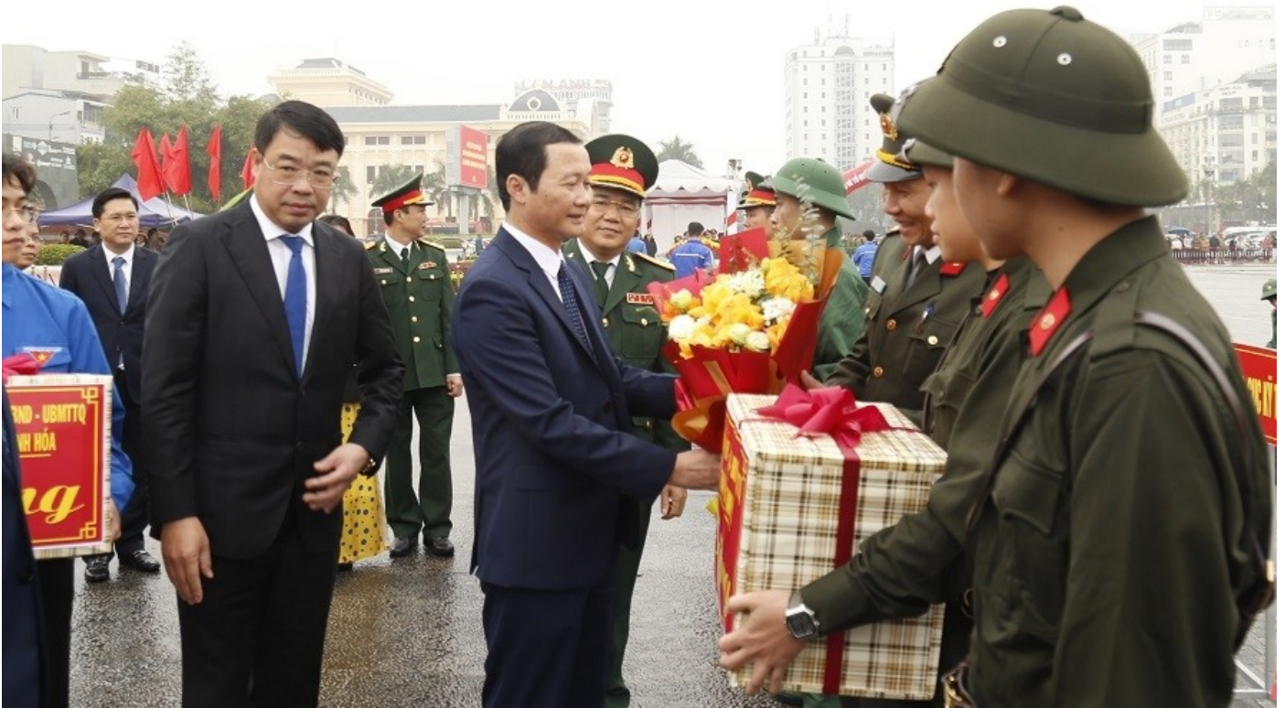
Đồng chí Đỗ Minh Tuấn, Phó Bí thư Tỉnh ủy, Chủ tịch UBND tỉnh, Chủ tịch Hội đồng Nghĩa vụ quân sự tỉnh động viên tân binh lên đường nhập ngũ tại điểm giao nhận quân TP. Thanh Hóa.

Năm 2024, thành phố Thanh Hóa có 175 thanh niên ưu tú lên đường nhập ngũ vào các đơn vị quân đội và công an, chỉ tiêu hoàn thành 100% kế hoạch.