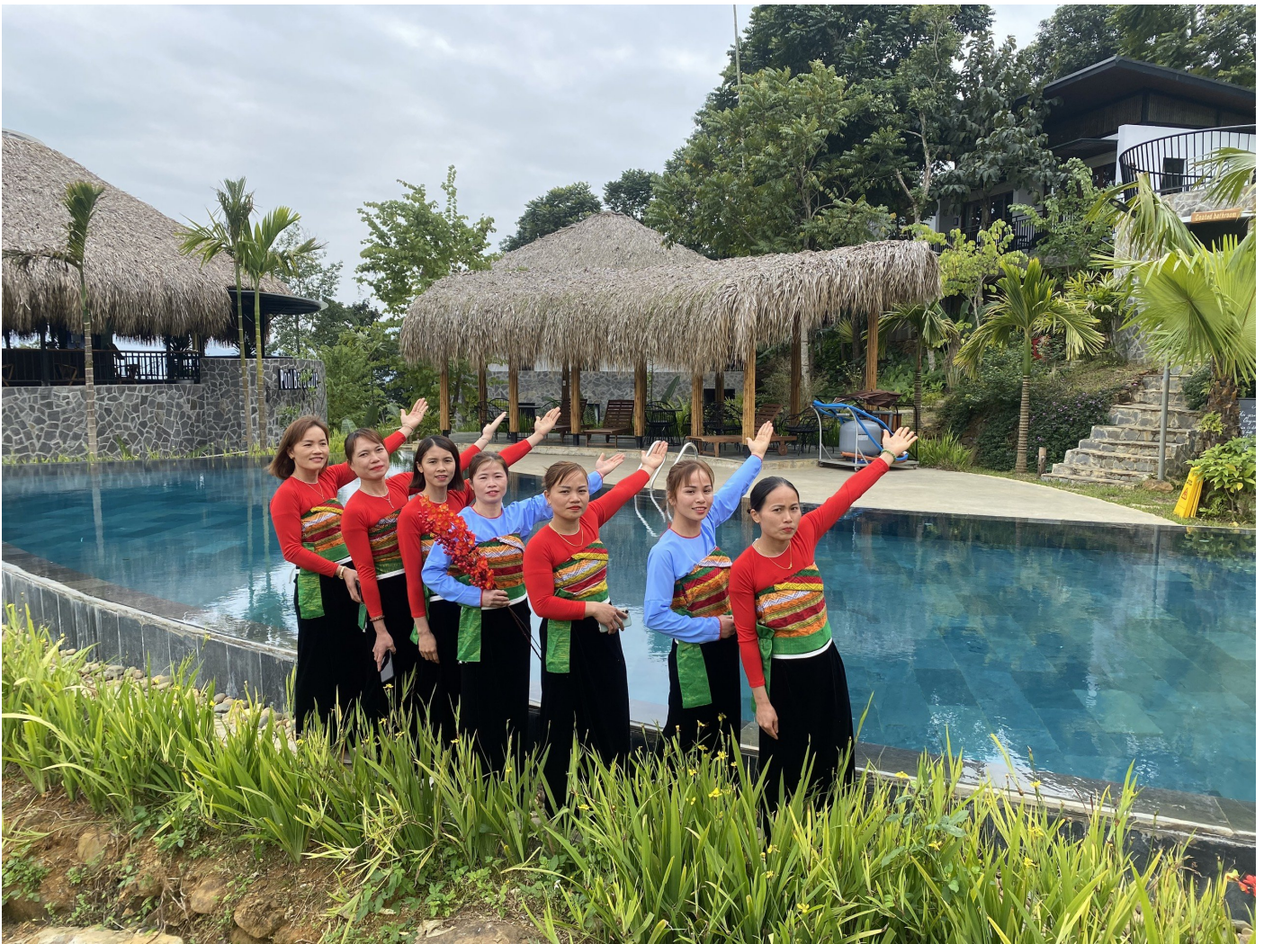
Gìn giữ các giá trị văn hóa bản địa trong phát triển du lịch

Tham gia chương trình liên kết, hợp tác với các địa phương du lịch với các địa phương, đáp ứng kịp thời nhu cầu của du khách. Từ những kinh nghiệm học hỏi được, trong phát triển du lịch cộng đồng tại các địa phương trong nước. Huyện Bá Thước luôn chú trọng công tác tuyên truyền, vận động, hướng dẫn người dân, các doanh nghiệp du lịch chung tay, hưởng ứng công tác bảo tồn, gìn giữ và phát huy các giá trị văn hóa bản địa, không phá vỡ cảnh quan thiên nhiên, với mục đích phát triển du lịch một cách bền vững.