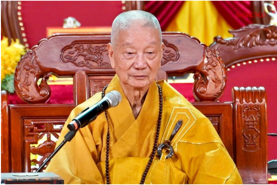
Tr??ng lão Hoà th??ng Thích Trí Qu?ng, ?? t? Pháp ch? Giáo h?i Ph?t giáo Vi?t Nam.

Tr??ng lão Hoà th??ng Thích Trí Qu?ng, ?? t? Pháp ch? Giáo h?i Ph?t giáo Vi?t Nam chia s?: “?oàn k?t trong giáo h?i, t? ?ó xây d?ng c??ng l?nh t? trên xu?ng d??i, hòa h?p trong Giáo pháp. T? trí tu? và k? c??ng là quan tr??ng ?? phát tri?n b?n v?ng. Ti?p t?c vi?c làm t?t, s?ng t?t ?? tr? thành nhân t? t?t trong xã h?i. N?u không có nhân tài, không có con ng??i tiêu bi?u thì không phát tri?n... T?t c? m?i ng??i chúng ta tìm ra nhân t? ?ó, ?n c?, và tu h?c t?i các tr??ng ??i h?c, phát hi?n và m?i v? ?? cùng giáo h?i cùng phát tri?n. Ti?p t?c s? nghi?p h?c c?a s? t? ?? tìm ra nhân tài.”