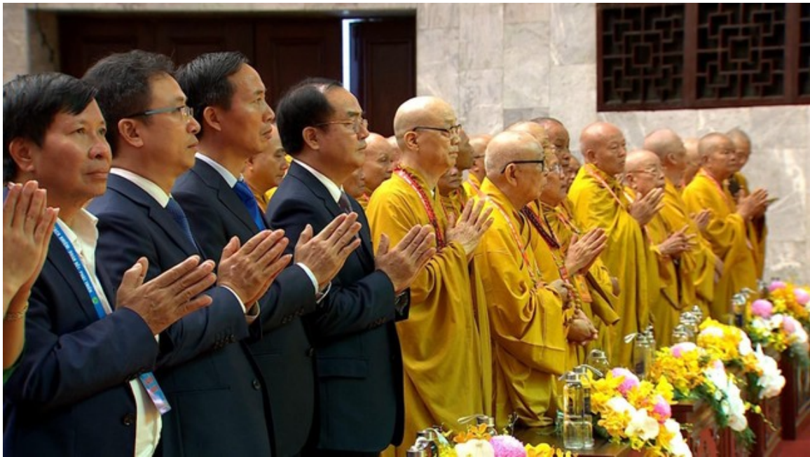
Các ??i bi?u tham d? phiên b? m?c.