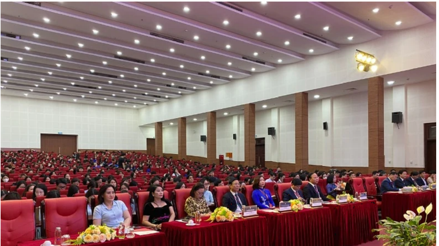
Các đại biểu và học viên tham dự lễ khai mạc

Tham dự chương trình có đại diện lãnh đạo Học viện Chính trị quốc gia Hồ Chí Minh, lãnh đạo Bộ Giáo dục và Đào tạo, lãnh đạo Trung tâm Kiểm định chất lượng giáo dục (Đại học Quốc gia Hà Nội), lãnh đạo Học viện Báo chí và Tuyên truyền, các chuyên gia, các nhà khoa học, cùng toàn thể cán bộ, giảng viên, sinh viên của nhà trường.