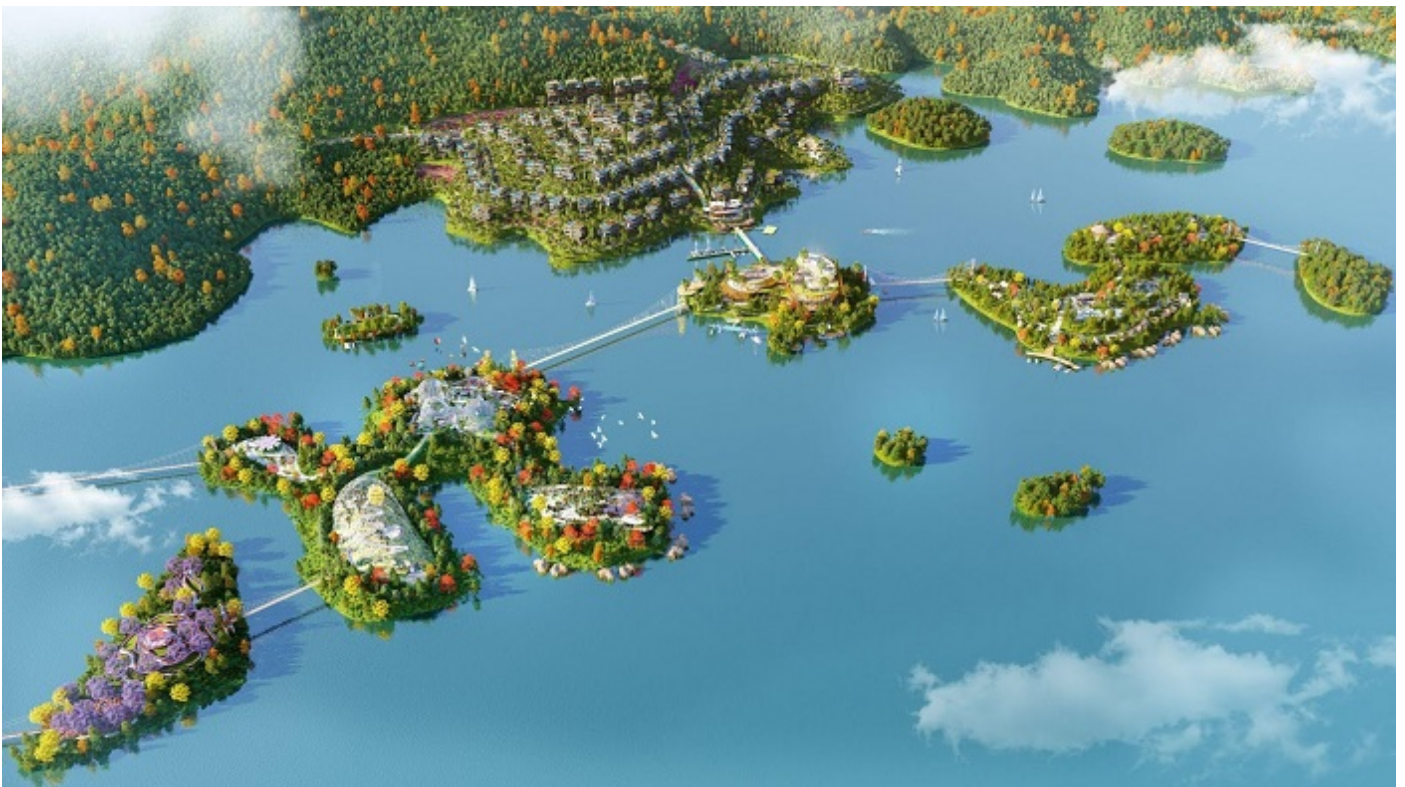
Phối cảnh dự án Flamingo Majestic Islands Resort.

Bến du thuyền riêng biệt, công viên đảo retreat, onsen khoáng nóng đến những liệu pháp tắm rừng, tắm cát thư thái cùng trung tâm dịch vụ sang trọng... đều được thiết kế để hiện thực hóa một phong cách sống đẳng cấp với tiêu chuẩn quốc tế 6 sao.